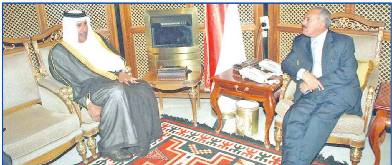
تلقي الرئيس اليمني علي عبدالله صالح مساء أمس الأول، رسالة من أمير دولة قطر الشيخ حمد بن خليفة آل ثاني تتعلق بالعلاقات الثنائية بين البلدين. وسلم الرسالة للرئيس اليمني رئيس الوزراء وزير الخارجية القطري الشيخ حمد بن جاسم آل ثاني، الذي وصل إلى صنعاء في وقت سابق في زيارة قصيرة لليمن. وأفاد مصدر يمني مطلع، بأن زيارة الشيخ حمد تهدف إلى تفعيل الاتفاقية التي رعتها قطر بين الحكومة اليمنية والحوثيين في عام 2007. وأشار المصدر إلى أن الدوحة أوضحت للحوثيين أنها "لن تبدأ أي مساعي وساطة لتسوية الأوضاع الأمنية والإنسانية في صنعاء، إلا في حال توافر أجواء تهدئة محفزة ومشجعة، تحثاً للمنتاريو الذي رافق مساعي الوساطة في عام 2007. وكان الرئيس اليمني أعلن عقب زيارة لأمبر قطر الشيخ حمد بن خليفة آل ثاني لصنعاء في 13 يوليو الماضي، تفعيل اتفاق الدوحة بين الحكومة اليمنية والحوثيين الموقع في عام 2007، بعد أن عُلق ثلاث سنوات. وفي الصورة جانب من لقاء الرئيس صالح والشيخ حمد في القصر الرئاسي بصنعاء أمس الأول.