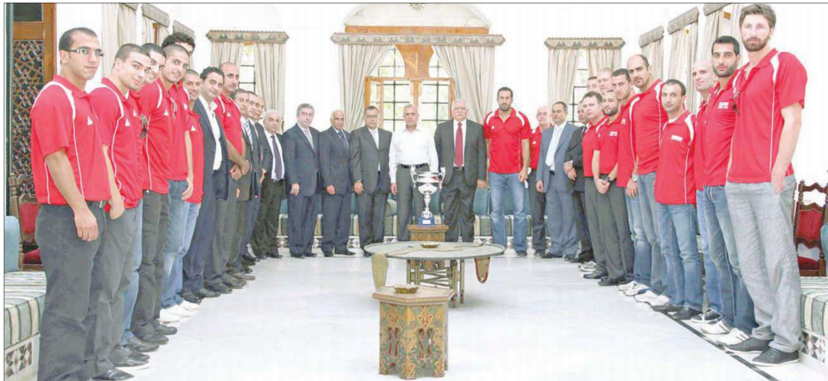
الرئيس ميشال سليمان مستقبلاً وفداً من الاتحاد اللبناني لكرة السلة في بيت الدين أمس (الأتي ونهرا)

وأشارت الصحفية إلى أن أوباما دعا تركيا إلى تخفيف لهجتها بشأن الهجوم الذي شنّه إسرائيل في 31 مايو الماضي على "أسطول الحرية" الذي كان يحمل مساعدات إلى قطاع غزة وإدى إلى مقتل تسعة أتراك وإصابة نحو 30 آخرين. ونفى البيت الأبيض لاحقاً هذا التقرير، وقال مساعد المتحدث باسم البيت الأبيض بيل برتون أمس الأول: "لا أدري على فرض عقوبات ضد إيران في الشهر نفسه. ونسيت الصحفية إلى مسؤول وصفته بـ"البارز في الإدارة الأميركية" قوله إن أوباما أبلغ أردوغان بعض الإجراءات التي اتخذتها تركيا "أثارت تساؤلات في الكونغرس بشأن ما إذا كنا نثق بتركيا كحليف، وهذا يعني أن بعض الطلبات التي قدمتها إليها، مثل تزويدها بأسلحة لمحاربة حزب العمال