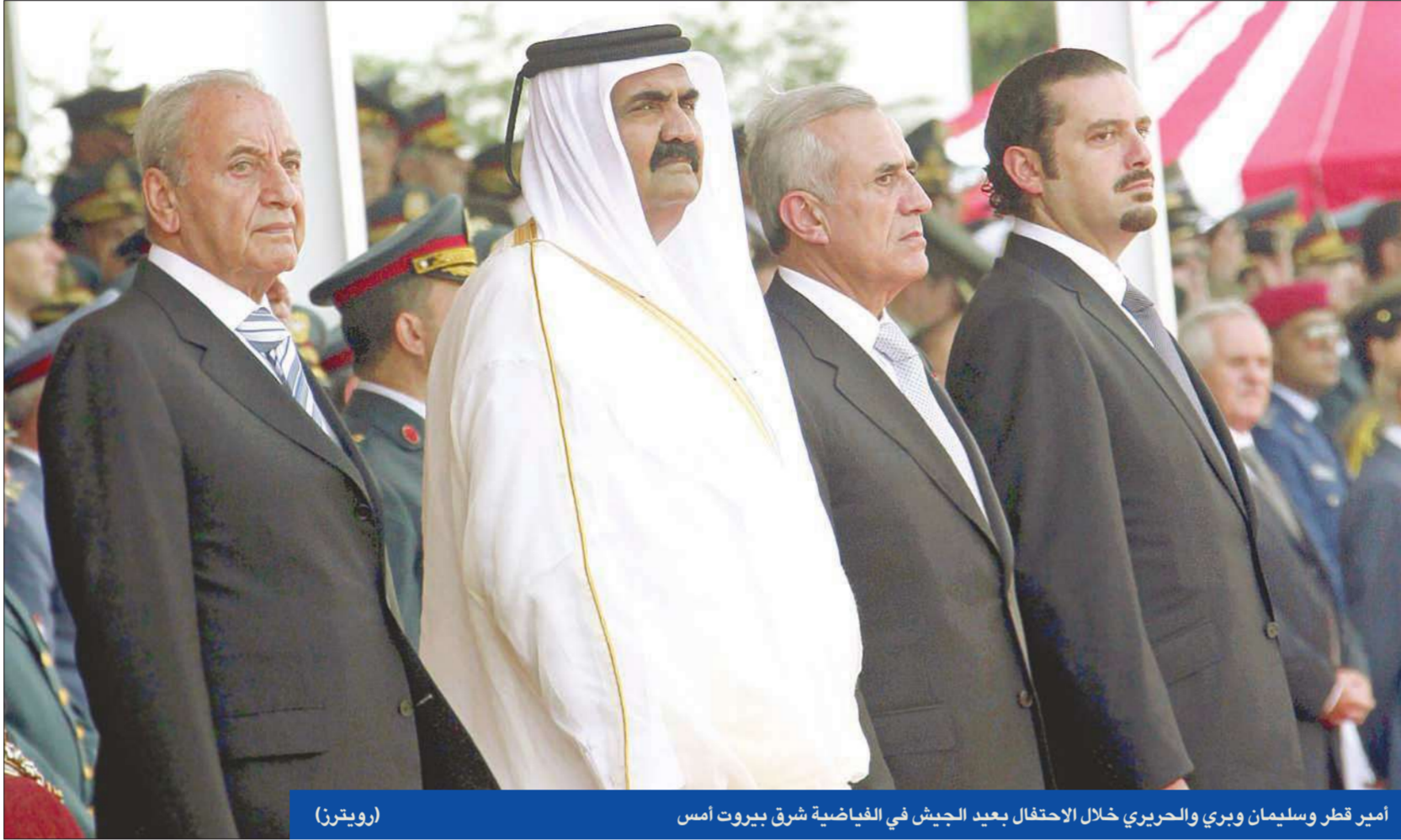
أمير قطر وسليمان وبري والحريري خلال الاحتفال بعيد الجيش في الفيضية شرق بيروت أمس

● أمير قطر يحضر حفل عيد الجيش... ويختتم زيارته للبنان ● عون: نواجه مؤامرة ولا يمكن «تليبس» جريمة لبريء