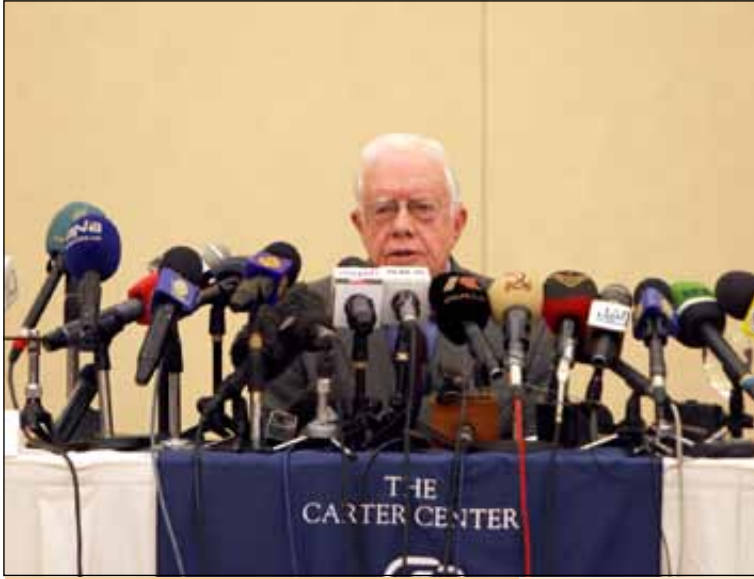
الرئيس الأميركي جيمي كارتر خلال مؤتمر صحفي في الخرطوم أمس