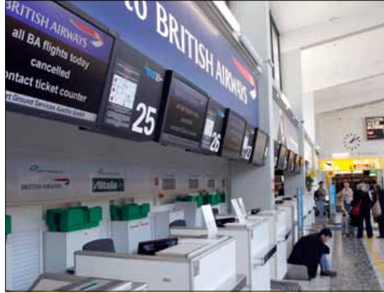
بعض المسافرين ينتظرون إكمال إجراءات سفرهم لفيينا