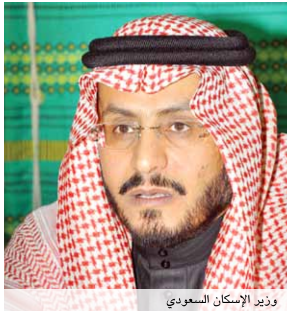
وزير الإسكان السعودي

وأوضح أن وزارة الإسكان تعمل الآن على إنشاء 200 ألف وحدة سكنية، وهي عبارة عن ثلاث مراحل، المرحلة الأولى 17 ألف وحدة سكنية، وهي تحت التنفيذ بنسب إنجاز من 20 إلى 95 في المئة انتهت، المرحلة الثانية 67 ألف وحدة انتهت تصميماً وتخطيطاً وهي في إجراءات الطرح، منها مشروع الرياض على وشك الترسية بعد فتح المضاريف، فيما يسلم مقاول التسوية الموقع في غضون شهر تمهيداً لبدء أعمال البناء وتوقع إعلان مشروع الرياض وهو 7200 وحدة سكنية خلال الأسابيع القليلة المقبلة. أما المرحلة الثالثة 116 ألف وحدة فمازالت مع المكاتب الهندسية وهي تحت التصميم تمهيداً لطرحها، ويمكننا الحديث عن أن لدى وزارة الإسكان ضمن خط الإنتاج الآن 200 ألف وحدة سكنية.