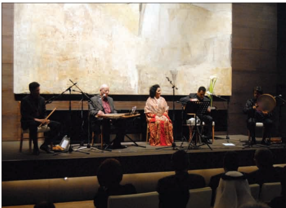
فرقة الأودار التي أدت مقامات العزف الصوفي

في مراحل تدرجه في المراقبة. والصوفيون يعتبرون أن هناك أربعة مقامات لكل منها عدد من المراحل تصل في نهايتها إلى درجة التنوير أو الفناء بالذات الإلهية. وهذه المقامات ومراحلها هي: مقام معرفة الذات، ومعرفة الكون، ومعرفة الخالق، وبقائه الله.