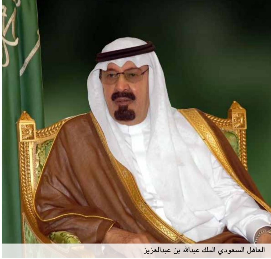
العاهل السعودي الملك عبدالله بن عبدالعزيز

وتشهد المنديات الإلكترونية ومواقع التواصل الاجتماعي جدلاً حاداً في بعض الأحيان بين مؤيدين ومعارضين لهذه التيارات.