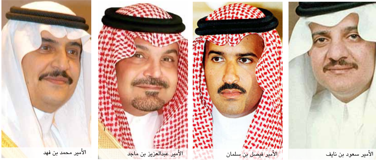
الأمير محمد بن فهد

أمر العاهل السعودي الملك عبدالله بن عبدالعزيز أمس الإثنين (14 يناير/ كانون الثاني 2013) بتعيينات شملت المنطقة الشرقية الغنية بالنفط حيث بجل الأمير سعود بن نايف محل الأمير محمد بن فهد، وكذلك المدينة المنورة. وذكرت وكالة الأنباء الرسمية أن الملك قرر تعيين الأمير سعود، النجل الأكبر لولي العهد الراحل الأمير نايف بن عبدالعزيز، أميراً للمنطقة الشرقية ليحل محل الأمير محمد نجل الملك الراحل فهد. كما أمر بتعيين الأمير فيصل بن سلمان نجل ولي العهد الحالي والمشرف على المجموعة السعودية للأبحاث والنشر، أميراً لمنطقة المدينة المنورة بدلاً من الأمير عبدالعزيز بن ماجد بن عبدالعزيز. يذكر أن الأمير محمد بن فهد (62 عاماً) الذي تولى منصبه العام 1985 حصل على شهادة من جامعة كاليفورنيا «سانتا باربرا» وكان مساعداً لنائب وزير الداخلية قبل تعيينه. وكان الأمير عبدالعزيز بن ماجد تسلم منصبه في العام 2006 خلفاً للأمير مقرن بن عبدالعزيز. وتأتي قرارات الملك بعد أيام من تعيين ثلاثين من الكوادر النسائية في مجلس الشورى حيث أصبحت نسبة تمثيل المرأة في التشكيك الجديدة للمجلس عشرين في المئة من الأعضاء. كما كان أعفى في الخامس من نوفمبر/ تشرين الثاني الماضي وزير الداخلية الأمير أحمد بن عبدالعزيز، الأخ غير الشقيق، من منصبه وعين مكانه مساعده للشؤون الأمنية الأمير محمد بن نايف.