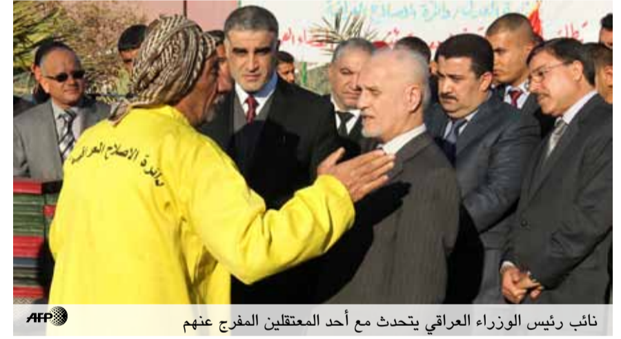
نائب رئيس الوزراء العراقي يتحدث مع أحد المعتقلين المفرج عنهم

وقال الشهرستاني خلال كلمة ألقاها في احتفالية أطلق خلالها سراح 178 معتقلاً في بغداد، مخاطباً المعتقلين «اعتذر باسم الدولة العراقية لأي واحد منكم تم اعتقاله والاحتفاظ به هذه الفترة، وثبتت بعد ذلك براءته»، وتابع أن «هذه الأمور تحدث ليس في العراق فقط لكن في