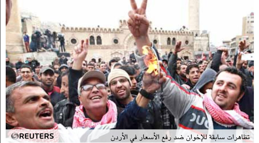
تظاهرات سابقة للإخوان ضد رفع الأسعار في الأردن

رويترز ان عدد المصابين بلغ 60 مصاباً. وقال شاهد عيان في اتصال مع فرانس برس ان «الاشتباكات» مستمرة منذ ثلاثة ايام بين معارضي الرئيس المصري الغاضبين الذين يحاولون اقتحام مقرات الجماعة في المدينة وبين مؤيديه من اعضاء الجماعة.