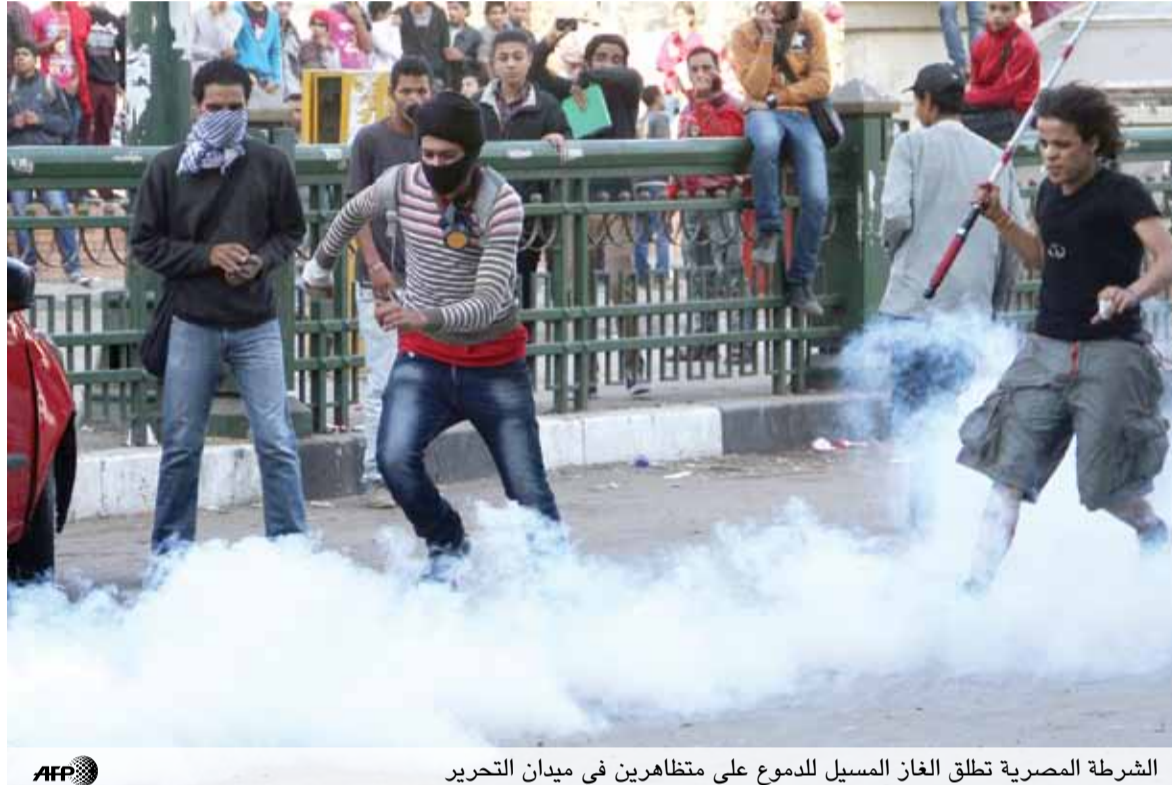
الشرطة المصرية تطلق الغاز المسيل للدموع على متظاهرين في ميدان التحرير