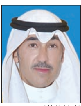
الشيخ فواز الخالد

أعرب محافظ الأحمدى الشيخ فواز الخالد عن خالص تعازيه لشعب المملكة العربية السعودية الشقيق ولأسرة الملكة الكريمة، لوفاة المغفور له بإذن الله تعالى خادم الحرمين الشريفين الملك عبدالله بن عبدالعزيز آل سعود -طيب الله ثراه- داعياً المولى عز وجل أن يتغمده بواسع رحمته، وأن يسكنه فسيح جناته وأن يجزيه خيراً عما قدمه لشعبه وأمتة من عطاء سيسجله له التاريخ