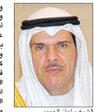
الشيخ سلمان الحمود

والإسلامية فقدت أحد فرسانها وقادتها الكبار الذين حملوا أمانة المسؤولية على مدى عقود ففكر وعمل واتسم بالصدق والحق والعدل وشجاعة الكلمة والموقف ما كان له الأثر البالغ والفعال في رفعة شأن المملكة العربية السعودية الشقيقة اقليمياً ودولياً وتوثيق عرى التعاون الخليجي والعربي والعالمى.