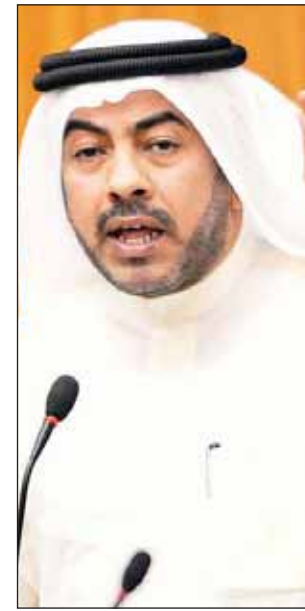
• علي الدقباسي

حذر النائب علي الدقباسي من تفاقم مشكلة توظيف الكوادر الوطنية في المستقبل، إذا استمرت السياسة التي تتبعها الجهات الحكومية حالياً. وأشار الدقباسي إلى التقرير الذي أصدره بنك الكويت الوطني منذ أيام عدة، والذي أشار فيه إلى أن توظيف الكويتيين يشهد أبطأ نموه له منذ 2006، إذ تراجع من 16 في المائة قبل سنة إلى 7 في المائة في نهاية الربع الأول من العام، في الوقت الذي يتم فيه تعيين غير الكويتيين، في ظل وجود كويتيين للوظائف نفسها.