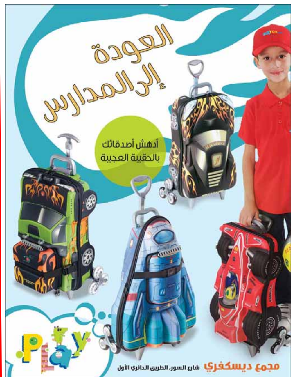
مجمع ديسكفري شارع السور، الطريق الدائري الأول

وأشاد الحويلة بالإنجازات التي تحققت في عهد الملك عبدالله بن عبدالعزيز آل سعود وخلال 6 أعوام مضت، منها إنشاء عدد من المدن الاقتصادية بمدينة الملك عبدالله الاقتصادية ومدينة الأمير عبدالعزيز بن مساعد الاقتصادية ومدينة جازان الاقتصادية ومدينة المعرفة الاقتصادية بالمدينة المنورة إلى جانب مركز الملك عبدالله المالي بمدينة الرياض، وأيضاً تضاعفت أعداد الجامعات بالملكة، مؤكداً أن عهد خادم الحرمين الملك عبدالله بن عبدالعزيز عهد تنوير لمسيرة التنمية المباركة منذ عهد الملك المؤسس إلى وقتنا الحاضر.