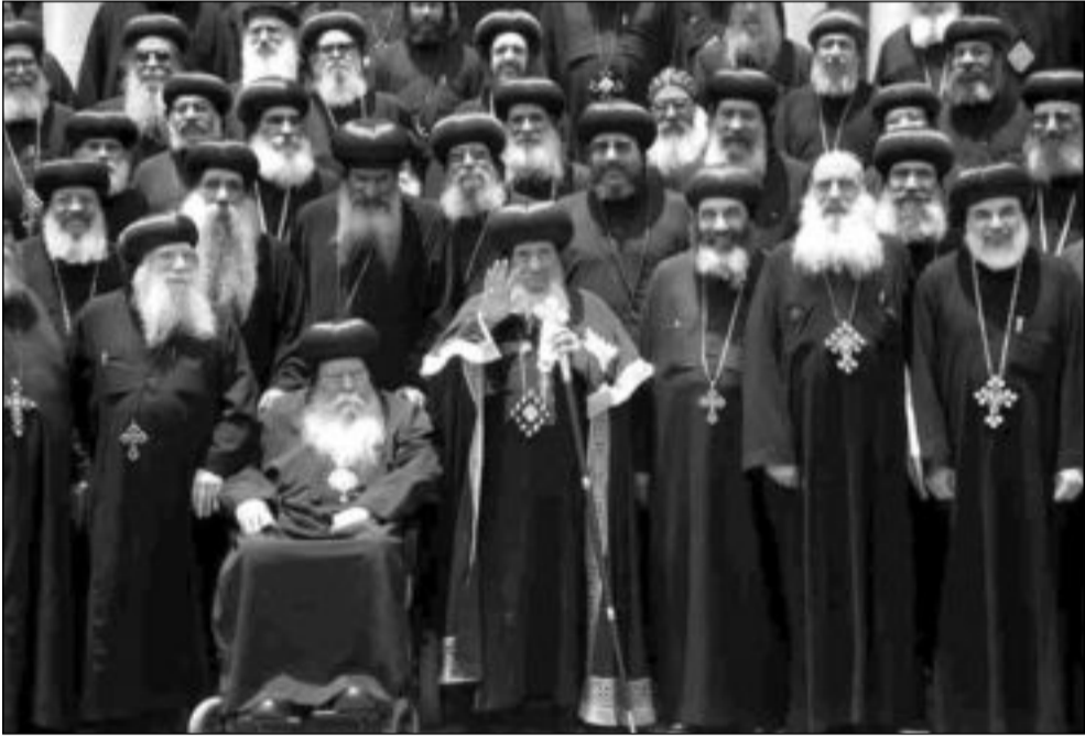
شنودة يتوسط أعضاء المجمع المقدس

«أكد مبدأ خصوصية تطبيق الشريعة المسيحية على أتباعها، وذكرت هذه المحاكم أيضاً أن البطريك ليس موظفاً عاماً إلزامه الأحكام المدنية، وأن القيادات الدينية شريعتها الإنجيل وقوانين الكنيسة»، وأضاف: «ما انتهت إليه المحكمة الإدارية العليا في مصر أمر لا تقبله ضمائرنا ولا نستطيع أن ننفذه». واعتبر أن من يلجأ من يلجأ من الإقباط للزواج المدني كحل لمشكلة الزواج الثاني، «سيصبح خارجاً عن الكنيسة ومفصولاً منها لأن الزواج في الكنيسة له قدسية خاصة، وأكد ثقته في «الدولة وأنها تؤمن باحترام الشرائع السماوية وفقاً للدستور ولا تقبل أبداً أن يكون الإقباط مضغوطين عليهم في دينهم»، وأشار شنودة إلى أن الزواج الثاني ممنوح به في حالات كثيرة، منها الزوج أو الزوجة الأمروأول أو في حالة الطلاق لعدة الرنا ويسمح به فقط للطرف البري».