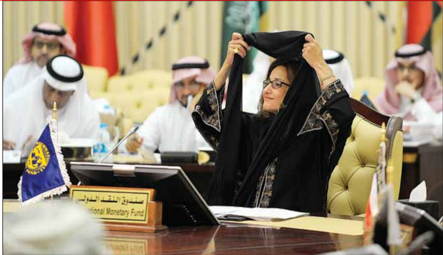
• نائبة مدير صندوق النقد نعمت شفيق خلال اجتماع وزراء المالية الخليجين أمس الأول في الرياض

الاتحاد الخليجي التي دعا لها الملك السعودي عبدالله بن عبد العزيز في ديسمبر 2011. وقال وزير المالية السعودي الدكتور إبراهيم العساف عقب افتتاحه، مقر المجلس النقدي الخليجي، «إن بلاده ملتزمة بكل ما يسهم في تعزيز التعاون والتكامل الخليجي والوصول إلى مرحلة الاتحاد الخليجي التي دعا إليها الملك عبدالله بن عبدالعزيز في الدورة الثانية والثلاثين لدول الخليج التي عقدت في الرياض في 19 ديسمبر 2011 إلى الانتقال من مرحلة التعاون إلى مرحلة الاتحاد»، مشيراً إلى أن «افتتاح المقر يعد خطوة مهمة في مسار الاتحاد النقدي». وأضاف «أن التحديات التي تعيها منطقتنا تؤكد أهمية التعاون والتكامل بين دولنا مما يحتم علينا جميعاً مضاعفة الجهود لتحقيق التكامل الاقتصادي من خلال استكمال أركانه المتمثلة بالاتحاد الجمركي، والسوق الخليجي المشترك، والاتحاد النقدي».