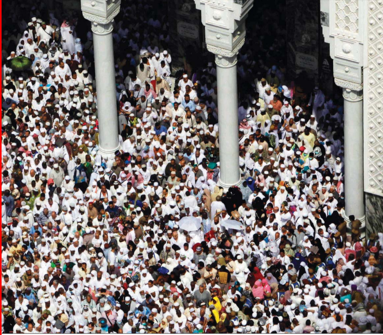
• جمع الحجاج يواصلون أداء المناسك