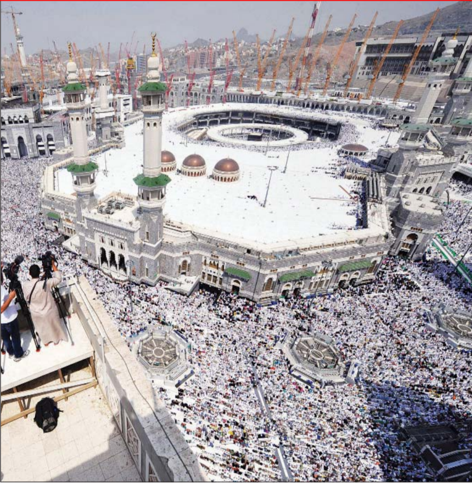
• الحرم المكي في أبهى صورته