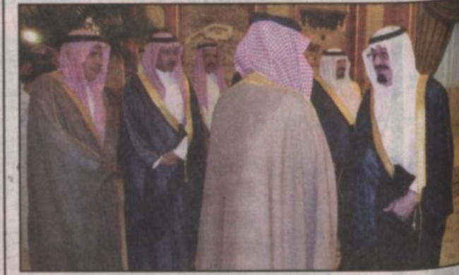
سمو ولي العهد يستقبل أبناء المرحوم محمد بن صالح بن سلطان (واس)