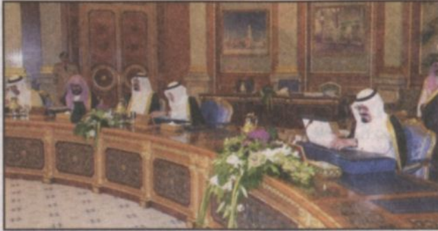
على ذلك وبعد النظر في قرار مجلس الشورى رقم 23/27 وتاريخ 14/5/1424هـ قرر مجلس الوزراء الموافقة على الضمان للملكة إلى منظمة السياحة العالمية طبقا لقانونها الأساسي كما نص القرار على التزام المملكة بالقانون الأساسي للمنظمة المنوه

جدة - واس: رأس صباح السمو الملكي الأمير عبد الله بن عبدالعزيز آل سعود ولي العهد نائب رئيس مجلس الوزراء ورئيس الحرس الوطني حفظه الله الجلسة التي عقدها مجلس الوزراء بعد ظهر أمس الاثنين في قصر السلام بمحافظة جدة. وقد أصرّب سمو ولي العهد في بدء الجلسة باسم خادم الحرمين الشريفين الملك فهد بن عبدالعزيز آل سعود حفظه الله واسمه بن أخص تهاديه وأصدق مشاعره وأعقّب تمنياته للوطن والمواطنين بمناسبة الذكرى الثالثة والسبعين لليوم الوطني للمملكة العربية السعودية التي تصاف هذا العام اليوم الثلاثاء الأول من العشران الموافق السادس والعشرين من شهر رجب 1424هـ الثالث والعشرين من شهر أيلول سبتمبر 2003م فالشكر والثناء للبراري عز وجل الذي آفاه على الجميع من النعم وفي طليعتها نعمة الاسلام والأمن والاستقرار. وشدّد حفظه الله على أن هذه الذكرى العظيمة التي تعيد إلى الأذهان ذلك الانجاز الكبير الذي بدأه الملك المؤسس عبدالعزيز بن عبد الرحمن آل سعود وجاهه المخلصون وتوجه باعلان اتمام توحيد أجزاء البلاد وتوطيد أركانها ودعائها لروح بنائها واطلاق اسم المملكة العربية السعودية. في التاسع عشر من جمادى الأولى لعام 1251هـ توجبا لمسيرة طويلة من الكفاح بدأت باستعادة الرياض في الخامس من