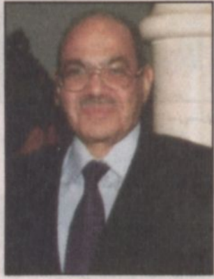
السفير المصري، محمد خليل

وصولهم الى الرياض؟ د. الربيعية: اتوقع وصولهم خلال اسبوع الى عشرة ايام. «الرياض»: فور وصولهم ماهي استعداداتكم لذلك؟ د. الربيعية: سيكون هناك فريق طبي في استقبالهم بالمطار وسيتم نقلهم الى جناح الأطفال وتم تهيئة غرفة خاصة للتوأمتين وتأمين السكن لوالديهما وسيتم كذلك تشكيل الفريق الطبي المشارك ونبداً بعدها بعمل الفحوصات الطبية سواء الأساسية أو المتخصصة للتوأم.