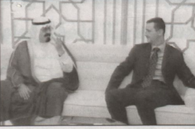
ووصول سموولي العهد سوري (وا س)

وصاحب السمو الامير فيصل بن عبدالله بن محمد ال سعود مساعد رئيس الاستخبارات العامة وصاحب السمو الملكي الامير محمد بن نواف بن عبدالعزيز سفير خادم الحرمين الشريفين في إيطاليا وصاحب السمو الامير تركي بن عبدالله بن محمد ال سعود المستشار في ديوان سمو ولي العهد وصاحب السمو الامير الدكتور بندر بن سلمان بن محمد ال سعود المستشار في ديوان سمو ولي العهد وصاحب السمو الملكي الامير عبدالعزیز بن فهد بن عبدالعزيز وزير الدولة عضو مجلس الوزراء رئيس ديوان رئاسة مجلس الوزراء وصاحب السمو الملكي الامير ماجد بن عبدالله بن عبدالعزيز ومعالي رئيس مجلس الوزراء