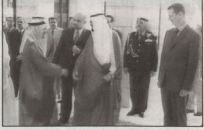
ووصول سموولي العهد سوري (وا س)

جدة، دمشق - واس - عقد صاحب السمو الملكي الأمير عبدالله بن عبدالعزيز ولي العهد نائب رئيس مجلس الوزراء رئيس الحرس الوطني وأخوه فخامة الرئيس الدكتور بشار الاسد رئيس الجمهورية العربية السورية الشقيقة اجتماعاً مساء امس في القاعة الدمشقية بدمشق.