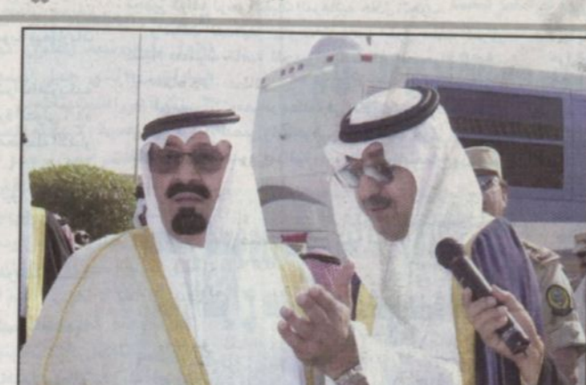
سمو ولي العهد يستمع إلى شرح من الأمير فيصل بن عبدالله