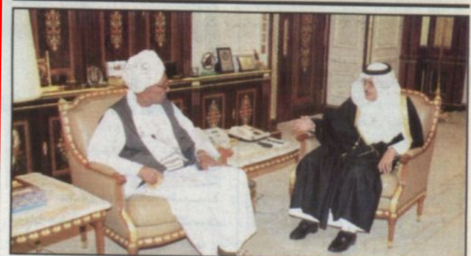
الأمير نايف بن عبد العزيز