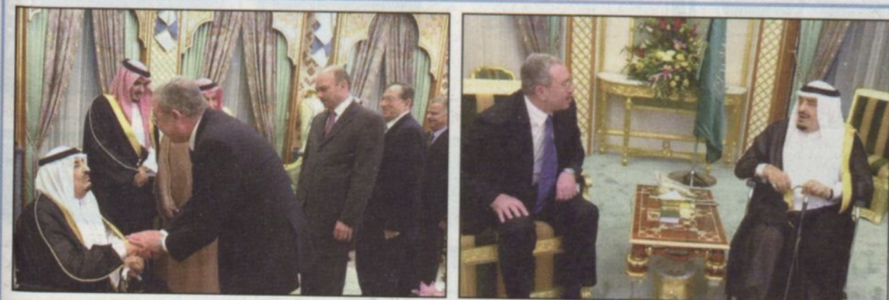
خادم الحرمين مستقبلاً رئيس وزراء الأردن (و.ا.س) والخاص لخادم الحرمين الشريفين الأستاذ محمد السليمان ومعالي نائب رئيس ديوان رئاسة مجلس الوزراء الأستاذ

عبد العزيز الخويطر ومعالي وزير الدولة عضو مجلس الوزراء الأستاذ علي بن طلال الجهني ومعالي رئيس المكتب