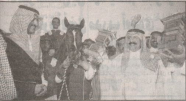
الأمير سلطان بن محمد واحتفالية سابقة بكأس ولي العهد (شعبان ١٤٢٢هـ).