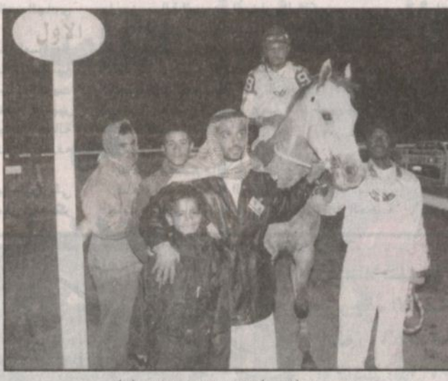
الحصان (الزاهل) الفائز بالشوط الثالث (ب)