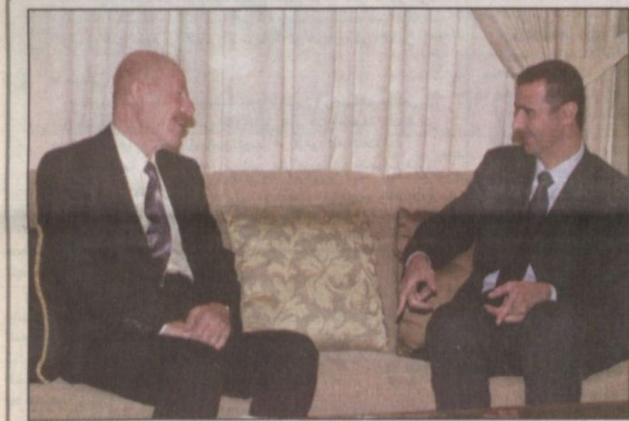
نائب الرئيس العراقي عزت ابراهيم يتحدث مع الرئيس السوري بشار الأسد في مقر سكنه بالفندق في بيروت

بيروت، مكتب «الرياض»، جان فغالي: زيارة الأمير عبدالله للبنان هي الثالثة في غضون خمس سنوات. الزيارة الأولى كانت في السادس والعشرين من أيار/ مايو عام ١٩٩٧م. والزيارة الثانية كانت في الثالث من آذار (مارس) عام ٢٠٠٠. أما زيارة اليوم فهي الأبرز حيث يتوقع أن يكون نجم القمة العربية التي ستكون قمة المبادرة السعودية.