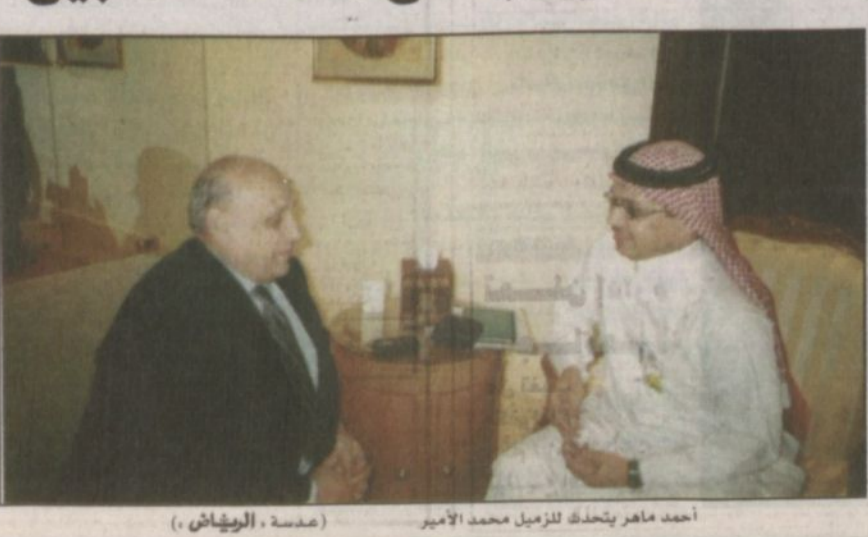
أحمد ماهر يتحدث للرئيس محمد الامير

وقال انه اقترح على الاسرائيليين الدخول في مفاوضات جادة على أساس الشرعية الدولية نقلاً عن روح المبادرة السعودية والتي هي روح الشرعية الدولية وروح القرارات للفة المتحدة وأمل ماهر ان تقوم الولايات المتحدة الامريكية بدور أكثر توازناً وأكثر انصافاً على مقتضيات العدالة خاصة وأن الولايات المتحدة دولة صديقة ونحن حريصون ان تعمل معنا على الخير وتحقي السلام. ومطالب ماهر بالانعقاد مؤتمر دولي لمكافحة الارهاب من أجل اجتثاثه مؤكدا انه يجب التفريق بين الارهاب وحق المقاومة من أجل النضال الوطني. وعن السوق العربية المشتركة قال ماهر ان مصر نادت منذ زمن طويل من أجل إيجاد الطرق والسبل لانجاح هذا المشروع والذي نحن بأحسن الحاجة اليه.