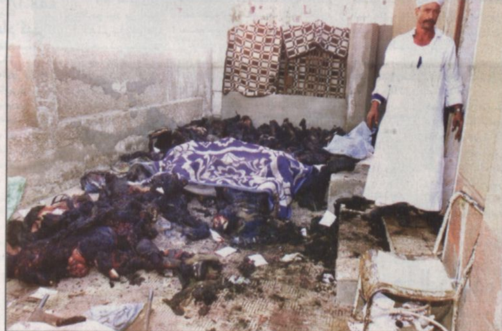
عامل في أحد المستشفيات المصرية بيلدة الصياح حيث تم تجميع جثث ضحايا حريق القطار المتفجعة بشكل مؤقت

مصر استيقظت على كارثة قطارات رهيبه مقتل نحو ٤٠٠ من المسافرين لقضاء اجازة العيد في حريق التهم ٧ عربات العيال - مصر، رويترز، أ.ف.ب: استيقظت مصر أمس على كارثة قطار ركاب أثناء توجهه إلى صعيد مصر قضي فيها ٣٥٠ راكباً على الأقل وقد يصل الرقم إلى نحو ٤٠٠ قتيل وذلك في أسوأ كارثة في تاريخ السكك الحديدية في مصر. وشب حريق هائل حوالي الساعة الواحدة والنصف صباح أمس في سبع عربات من القطار عند قرية كفر عمار على مسافة ٧٠ كيلومتراً جنوب القاهرة أثناء توجهه إلى الأقصر. وقال مسؤولون إن التحقيقات الأولية تشير إلى أن سبب الحريق يرجع إلى استخدام أحد الركاب موقداً داخل القطار. وقال أحمد عبدالعزيز وكيل وزارة