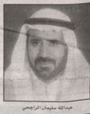
عبدالله سليمان الراجحي