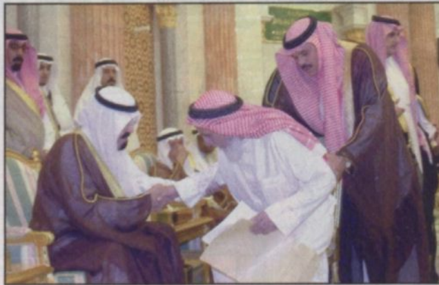
نائب خادم الحرمين الشريفين يستقبل جموعاً من المواطنين بؤس.

جدة - و.أ.س: استقبل صاحب السمو الملكي الأمير عبدالله بن عبدالعزيز نائب خادم الحرمين الشريفين في قصر سموه بجدة مساء أمس جموعاً من المواطنين الذين قدموا للسلام على سموه.