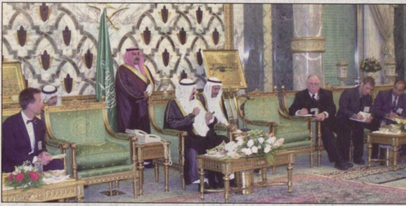
سموه يخاطب الكتاب

أتمنى أن يتحقق السلام قبل انتهاء ولاية بوش الأولى والشعب الأمريكي صديق لنا منذ ٦٠ عاماً