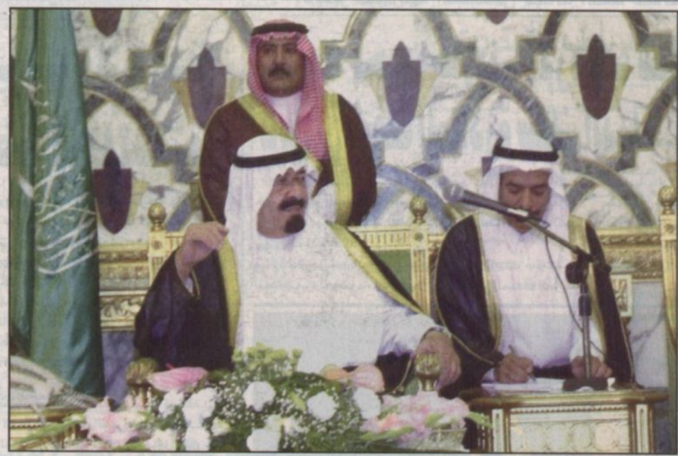
سمو نائب خادم الحرمين الشريفين لدى استقباله أعضاء الجمعية الوطنية لكتاب افتتاحيات الصحف الأمريكية - جدة (واس)

جدة - واس: استقبل صاحب السمو الملكي الأمير عبدالله بن عبدالعزيز نائب خادم الحرمين الشريفين في قصر سموه بسجدة أمس الاثنين ١٧/٦/٢٠٠٢م، مجموعة من أعضاء الجمعية الوطنية لكتاب افتتاحيات الصحف الأمريكية الذي يزورون المملكة حالياً. وقد دار بين سمو نائب خادم الحرمين الشريفين وبينهم حديث شمل العديد من الموضوعات التي تهم العلاقات بين المملكة العربية السعودية والولايات المتحدة الأمريكية وجهود السلام التي يقوم بها سموه حيال مشكلة الشرق الأوسط والقضية الفلسطينية واحلال السلام العادل بين جميع دول المنطقة وكذلك مبادرة السلام العربية وشأن الزيارة الرسمية التي قام بها صاحب السمو الملكي الأمير عبدالله بن عبدالعزيز للولايات المتحدة الأمريكية. وفيما يلي نص الحديث. (س) طرحتم سموكم خطة لتحقيق السلام في الشرق الأوسط ماذا تأملون سموكم تحقيقه من خطة السلام تلك. (ج) نأمل أن هذه المبادرة تؤدي لإيقاف سفك الدماء وإيجاد التلاحم بين شعوب المنطقة.