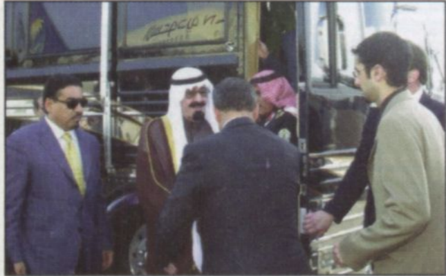
الأمير عبدالله مغادراً للولايات المتحدة