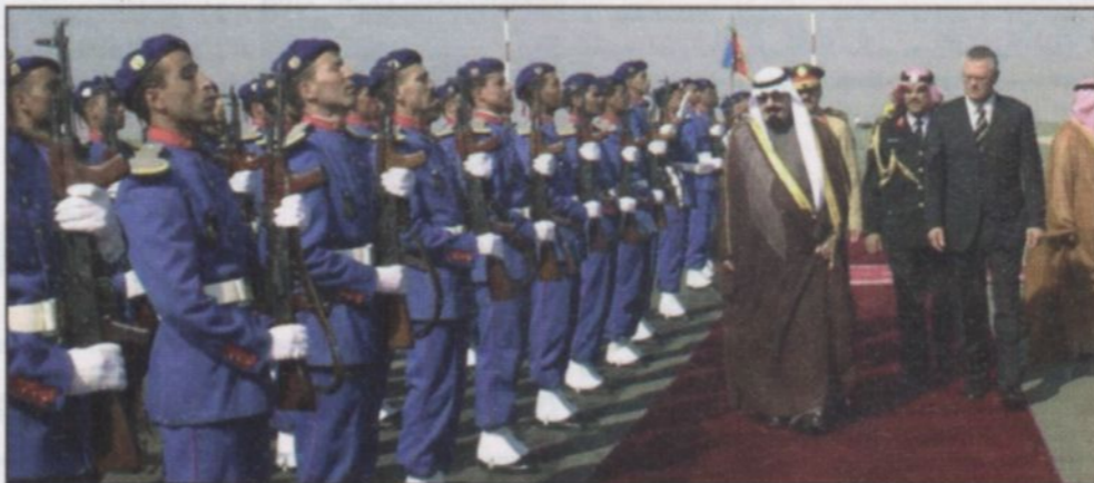
وصول سمو ولي العهد إلى الدار البيضاء

حفظ الله سمو ولي العهد في سفره وإقامته. ووصل في معية صاحب السمو الملكي الأمير عبدالله بن عبدالعزيز كل من صاحب السمو الأمير فيصل بن عبدالله بن محمد آل سعود وكيل الحرس الوطني بالقطيع الغربي وصاحب السمو الملكي الأمير خالد بن فيصل بن تركي بن عبدالعزيز آل سعود وصاحب السمو الأمير تركي بن عبدالله بن محمد آل سعود المستشار بديوان سمو ولي العهد وصاحب السمو الملكي الأمير عبدالعزيز بن عبدالله بن عبدالعزيز المستشار بديوان سمو ولي العهد وصاحب السمو الملكي الأمير عبدالعزيز بن سعود بن فيصل بن عبدالعزيز المستشار بديوان سمو ولي العهد وصاحب السمو الملكي الأمير عبدالعزيز بن فيصل بن عبدالعزيز وزير الدولة عضو مجلس الوزراء رئيس ديوان رئاسة مجلس الوزراء وصاحب السمو الملكي الأمير منصور بن عبدالله بن عبدالعزيز وصاحب الاستاذ عبدالرحمن الطاسان ومعالى نائب رئيس ديوان سمو ولي العهد والسكرتير الخاص الاستاذ خالد بن عبدالعزيز التوجيهي ومعالى وكيل المراسم الملكية الاستاذ محمد بن عبدالرحمن الطيبيني.