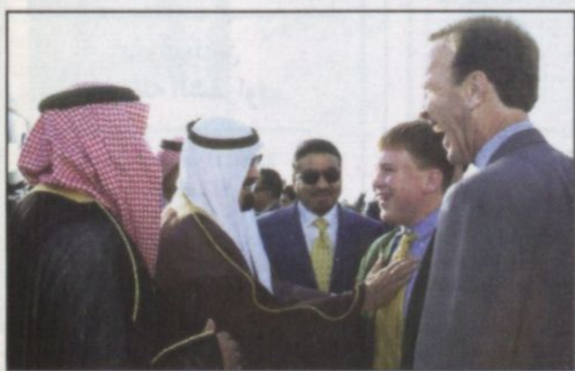
سمو ولي العهد خلال مغادرته أمريكا

وكان في وداعه بمقر إقامته صاحب السمو الملكي الأمير سعود الفيصل وزير الخارجية وجمع من المواطنين السعوديين المقيمين في أمريكا وعدد من الطلبة السعوديين الذين يتلقون دراساتهم في الولايات المتحدة الأمريكية. وعلى أرض مطار الينغتون العسكري في هيوستن كان في وداع سموه نيل بوش شقيق الرئيس الأمريكي جورج دبليو بوش وصاحب السمو الملكي الأمير بندر بن سلطان بن عبدالعزيز سفير خادم الحرمين الشريفين في واشنطن وصاحب السمو الأمير محمد بن فيصل بن تركي وصاحب السمو الملكي الأمير فيصل بن تركي بن ناصر بن عبدالعزيز وصاحب السمو الملكي الأمير سلمان بن سلطان بن عبدالعزيز وصاحب السمو الملكي الأمير خالد بن بندر بن سلطان بن عبدالعزيز ومعالى وزير المالية والاقتصاد