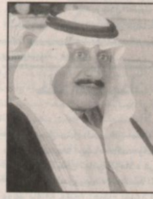
الأمير عبدالله بن عبدالعزيز بن مساعد

ركز الأول على المراكز الصيفيّة التي نظمتها الجامعة العام الماضي. بعد ذلك تم عرض لبعض نشاطات المركز من خلال الحاسب الآلي. وفي نهاية الحفل قدم وكيل الجامعة درعاً تذكاريّاً لسموه، بالإضافة الى هدية تذكاريّة، ثم قام سموه بتسليم وكيل الجامعة درعاً تذكاريّاً وكذلك تقديم درج المركز الأول لمدير المركز، ثم تكريم بعض الجهات المتعاونة مع المركز بتوزيع دروع وشهادات شكر لها.