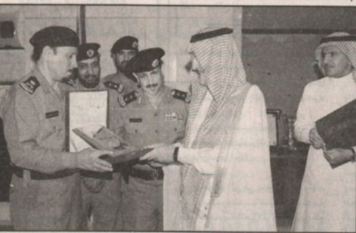
الأمير سطاتم خلال تسلمه التقرير السنوي لأمن الطرق بمنطقة الرياض

استقبل صاحب السمو الملكي الأمير سطاتم بن عبدالعزيز نائب أمير منطقة الرياض في مكتبه بقصر الحكم يوم أمس قائد القوة الخاصة لأمن الطرق بمنطقة الرياض العقيد عبدالهادي بن مخلد العتيبي بحضور مدير شرطة منطقة الرياض اللواء عبدالله بن سعد الشهراني. وقد سلم لسموه خلال اللقاء التقرير السنوي لقوات أمن الطرق الذي اشتمل على الجهود التي بذلها رجال أمن الطرق خلال العام المنصرم ١٤٢٢هـ كما تسلم سموه درعاً تذكاريّاً لجهودهم التي يقوم بها رجال أمن الطرق وتجسد وعيهم وحسن ادائهم لأعمالهم واستشعاراً بهذه المناسبة. وعبر سموه عن شكره وتقديره لجهود المبدولة التي يقوم بها رجال أمن الطرق وتجسد وعيهم وحسن ادائهم لأعمالهم واستشعاراً بهذه المناسبة. متمتنياً سموه لهم دوام التفوق والنجاح وأن يديم على بلادنا نعمة الأمن والأمان في ظل القيادة الحكيمة.