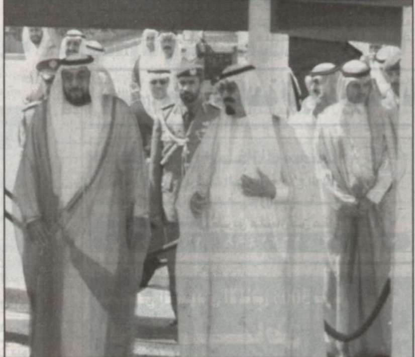
الأمير عبدالله بن عبدالعزيز مستقبلاً الشيخ خليفة بن زايد (واس)