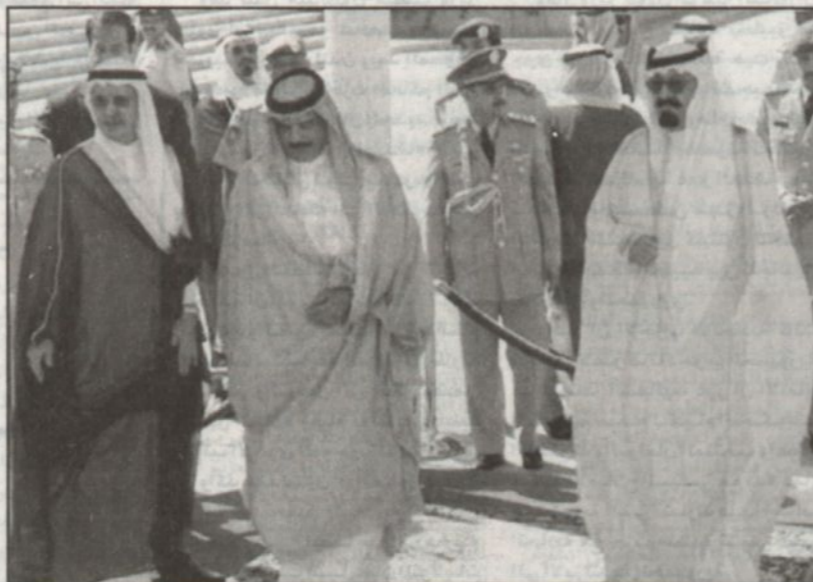
الأمير عبدالله مستقبلاً الشيخ حمد بن عيسى آل خليفة