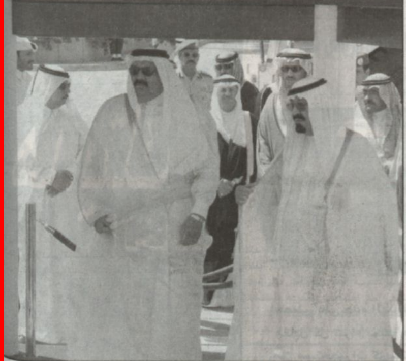
الأمير عبدالله مستقبلاً الشيخ حمد بن خليفة آل ثاني (و.أس)