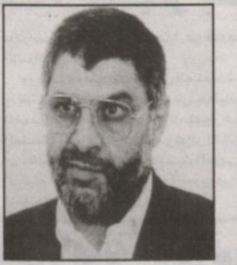
عبد العزيز الرنتيسي

القدس بإشراف صاحب السمو الملكي الأمير نايف بن عبدالعزيز وزير الداخلية. هذا بالإضافة إلى التبرعات العينية مثل السيارات وسيارات الإسعاف والمعدات والمجوهرات والمواد الطبية. وفي ذات الصد أكد بييل أبو ردينة المستشار الإعلامي للرئيس الفلسطيني في تصريح خاص لـ «الرياض» أن المساعدات الإنسانية للمكوبين من قبل المملكة العربية السعودية تعتبر من أروع ما فعلته المملكة في دعم القضية الفلسطينية في تحمل قدر كبير من المسؤولية لتصرة الشعب الفلسطيني مشيراً إلى أن الدعم السعودي مستمر وعلى كافة الأصعدة والمستويات السياسية والمالية والمعنوية.