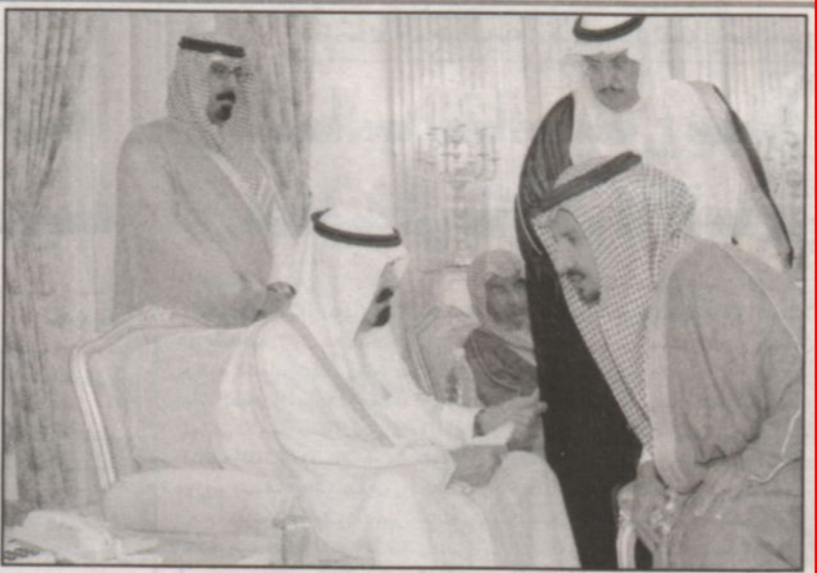
نائب خادم الحرمين خلال استقباله الأمراء والمواطنين