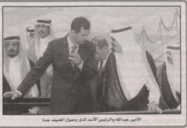
الأمر عبد الله والرئيس الأسد لدى وصول الضيف جدة