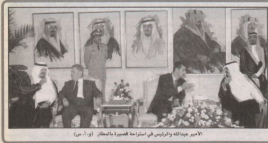
الأمر عبد الله والرئيس في استراحة قصيرة بالمطار