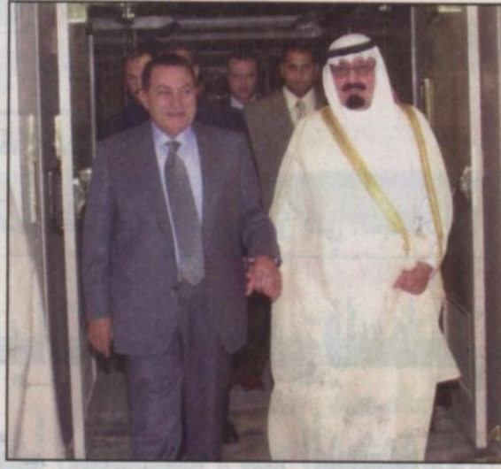
وصول الرئيس المصري إلى الرياض

ترسل كوبونات المسابقة الواحدة (كل نصف شهر) مجتمعاً على العنوان البريدي: ص.ب ٨٥١ الرياض. ١١٤٢١ ويكتب على الطرف من الخارج مسابقة «الرياض» الكبرى مع إيضاح رقم المسابقة. تعلق نتائج الفوز بعد شهر من نشر السؤال الأخير لكل فترة مسابقة واحدة. لا يحق لمنسوبي مؤسسة البعامة للصحافة الاشتراك في المسابقة للاستفسار (٤٨٧١٠٠٠) تحويلة (٢١٦٦٠ - ٢١٩٩) مع تمنياتنا للجميع بالتوفيق.