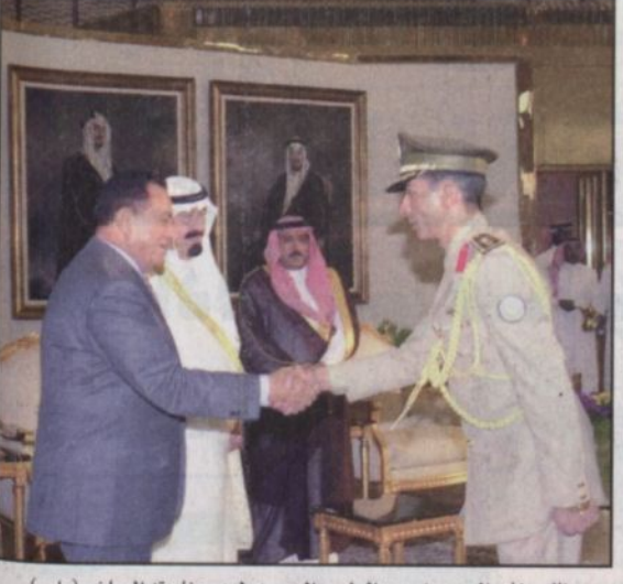
نائب خادم الحرمين يودع الرئيس المصري لدى مغادرته الرياض