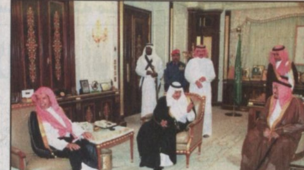
جانب من استقبال سمو وزير الداخلية