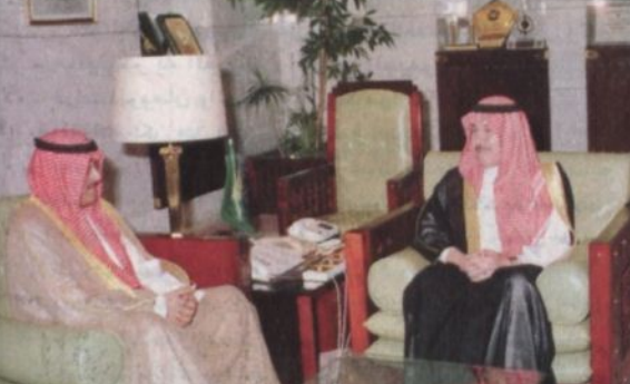
سمو نائب أمير منطقة الرياض يستقبل السفير الكويتي (واس)

الرياض - واس: ■ استقبال صاحب السمو الملكي الأمير سطاتم بن عبدالعزيز نائب أمير منطقة الرياض بمكتب سموه بقصر الحكم أمس سفير دولة الكويت لدى المملكة الشيخ جابر دعيج الابراهيم الصباح. وجرى خلال الاستقبال تبادل الاحاديث الودية واستعراض عدد من الموضوعات ذات الأهتمام المشترك بين البلدين الشقيقين.