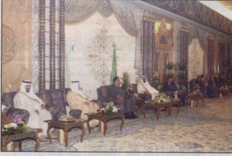
نائب خادم الحرمين يجتمع إلى مبارك ويقدم حفل غداء لضخامته..