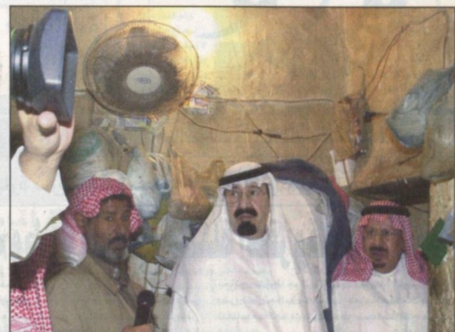
الأمير عبدالله يستمع الى الناس في بيوتهم أثناء جولته التفقدية لأوضاع الفقراء في وسط الرياض أمس