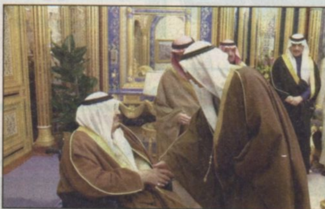
خادم الحرمين الشريفين يستقبل السفراء المعينين لدى البحرين والدمارك وليبيا (واس)