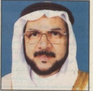
د. عبدالله الحصين

كتب - محمد السهلي: يوقع وكيل كليات البنات بوزارة المعارف الدكتور عبدالله بن علي الحصين بعد ظهر يوم السبت المقبل بتوقيع عقدين بقيمة ١١٠ ملايين ريال ويتضمن العقدان مشروع المبنى الأكاديمي لكليتي التربية - الأقسام العلمية - بجدة بمبلغ ٦٠ مليون ريال ومشروع المبنى الأكاديمي لكلية التربية - الأقسام الأدبية - بأبها بمبلغ ٥٠ مليون ريال. وذلك مع إحدى الشركات الوطنية بمقر وكالة كليات البنات بالرياض.