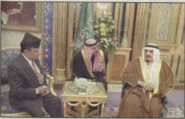
خادم الحرمين الشريفين يستقبل سفير نيبال (واس)