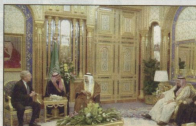
خادم الحرمين الشريفين يستقبل عضو مجلس الشيوخ الأمريكي جوزيف ليريمان (واس)