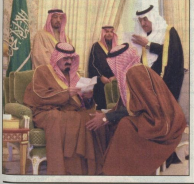
الشيخ صالح بن عبدالعزيز آل الشيخ ان المملكة العربية السعودية بقيادة خادم الحرمين الشريفين للملك فهد بن عبدالعزيز آل سعود، وصاحب السمو الملكي الأمير عبدالله بن عبدالعزيز آل سعود ولي العهد نائب رئيس مجلس الوزراء رئيس الحرس الوطني حفظهما الله لن تتأثر على الإطلاق من الهجمات الاعلامية وامتثالها الشرسة التي تشن عليها شرمة إن شاء الله.

صالح بن عبدالعزيز آل الشيخ ان المملكة العربية السعودية بقيادة خادم الحرمين الشريفين للملك فهد بن عبدالعزيز آل سعود، وصاحب السمو الملكي الأمير عبدالله بن عبدالعزيز آل سعود ولي العهد نائب رئيس مجلس الوزراء رئيس الحرس الوطني حفظهما الله لن تتأثر على الإطلاق من الهجمات الاعلامية وامتثالها الشرسة التي تشن عليها شرمة إن شاء الله. وقال معالي في تصريح صحفي، عقب وصوله الكويت، ان هذه الحملة الاعلامية معروفة وامتثالها على المملكة العربية السعودية معروفة والمصادر والاهداف، والمملكة دولة قامت على الاسلام من اول يوم، لم تلتفت يوماً أو يسأراً لتلقي منهج أو ميذا أو دستور، وانما قامت على كتاب الله جل وعلا وسنة رسوله صلى الله عليه وسلم مبتدأ من أسسها الملك عبدالعزيز بن عبد الرحمن آل سعود رحمه الله تعالى وهي على هذا المبدأ لأنها قنطرة شرعية ودينية ومعنوية، مشيراً معاليه الى ان المشكلات التي تعرض في اي وقت تحل، اما ترك المبادئ والتساهل فيها فهذا ليس من سيبل المملكة فنحن محافظون على أسسنا ومبادئنا ووثايقنا.