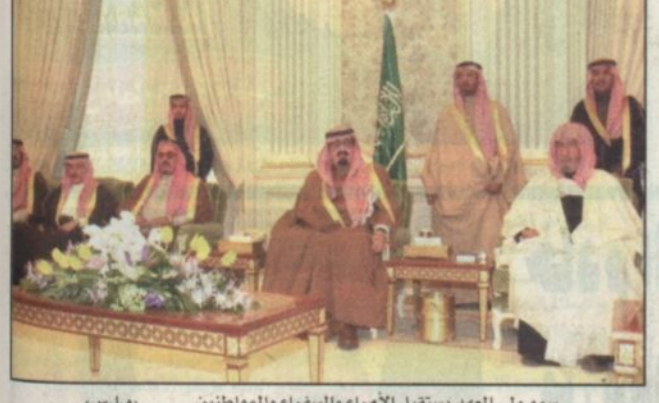
سمو ولي العهد يستقبل الأمراء والسفراء والمواطنين

ديب - مكتب الرياض - علي القصيص، أعربت قريفة صاحب السمو رئيس دولة الإمارات العربية المتحدة سمو الشيخة فاطمة بنت مبارك - رئيسة الاتحاد النسائي العام - عن خالص امتنانها بمنح سموها درج جامعة الإمام محمد بن سعود الإسلامية تقديراً لجهودها الرائدة في نشر الوعي الديني لدى الأسرة الإماراتية، وأكدت أنها تبنت هذا الدور من منطلق إيمانها بأهمية الدين كموروث ثقافي ورافد اساس لتشكيل وعي الإنسان. وأوضحت سموها ان الأسرة الخوة الأساسية للمجتمع وفي صلاحها انعكاس إيجابي على تقدم المجتمع ورفيه واستقراره وامنه وسلامة افراده. وقالت في تصريح خاص لـ الرياض، يؤلمني كثيراً ان