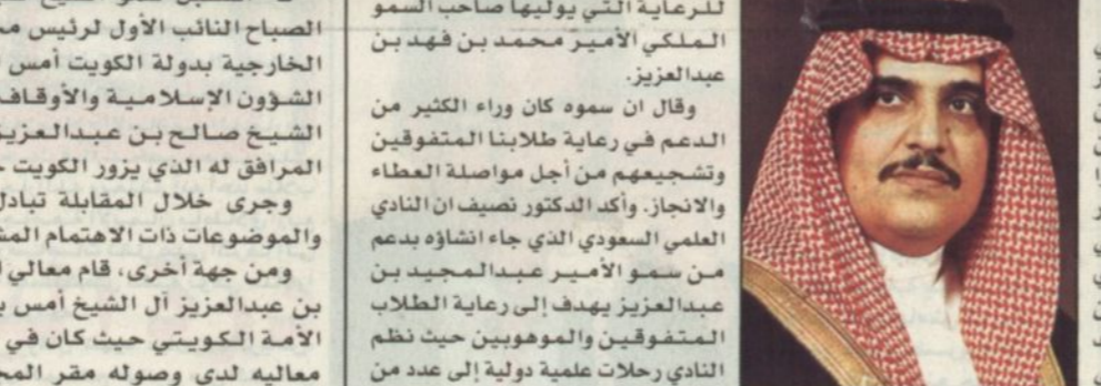
الأمير محمد بن فهد

الرياض - واس، يلتقي صاحب السمو الملكي الأمير محمد بن فهد بن عبدالعزيز أمير المنطقة الشرقية يوم غد الاثنين وفد أوائل الطلبة المتفوقين والموهوبين اليابانيين الذين شاركوا في مؤتمر الشيدو عبر الأقمار الصناعية في شهر شعبان الماضي والذي نظمه النادي العلمي السعودي المتفوقين ونظرائهم اليابانيين وذلك في إطار التبادل والتعاون العلمي والثقافي بين البلدين الصديقين. وسيقوم الوفد الياباني بعد اللقاء بزيارة أرامكو السعودية وآبار البترول ومعرض أرامكو الدولي.