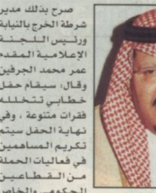
الأمير نايف بن عبدالعزيز

الرياض - واس، حضر ختام أعمال اللجنة الإعلامية للحملة التوعوية الأمنية التي ترعاها وزارة الداخلية في فندق شمس، حضره صاحب السمو الملكي الأمير عبد الرحمن بن ناصر بن عبدالعزيز محافظ الخبر يوم غد الاثنين بحضور عدد من المسؤولين الحكوميين والخاصين وتكريم أعضاء اللجنة. وأضاف: تم توجيه الدعوة لسمراء الدوائر الحكومية وزواة المراكز ورجال الأعمال لحضور هذا الحفل الختامي.