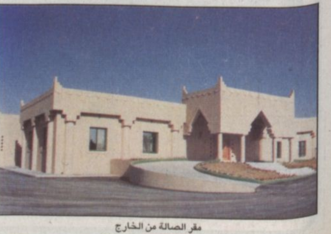
مقر الصالة من الخارج

تحقيق - خالد الزيدان: بتوجيهات من صاحب السمو الملكي الأمير عبدالله بن عبدالعزيز ولي العهد نائب رئيس مجلس الوزراء ورئيس الحرس الوطني رئيس نادي الفروسية وإشراف من صاحب السمو الملكي الأمير بدر بن عبدالعزيز نائب رئيس الحرس الوطني نائب رئيس نادي الفروسية افتتح صالة مزاد الخيل الجديدة بالجنادرية يوم الاثنين الماضي بتشريف من صاحب السمو الملكي الفريق ركن متعب بن عبدالله بن عبدالعزيز نائب رئيس الجهاز العسكري بالحرس الوطني قائد كلية الملك خالد العسكرية رئيس اللجان الفنية بنادي الفروسية وبحضور صاحب السمو الأمير سلطان بن محمد عضو نادي الفروسية المشرف العام على اسطبل أبناء الأمير محمد بن سعود الكبير وعدد من محبي الخيل ومربيها ورجال الأعمال. وبهذه المناسبة تحدث للمحقق عدد من مديري الخيل وفي البداية قال سعود بن