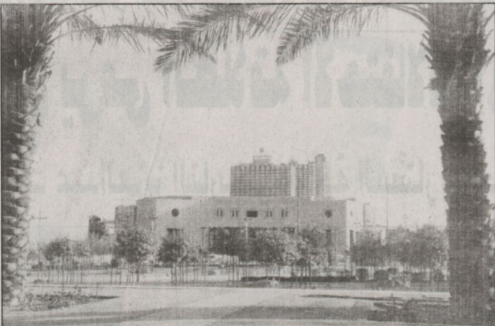
فرع المكتبة الجديد بمركز الملك عبدالعزيز التاريخي

وعن استعدادات المكتبة للمشاركة في الاحتفال بمرور مائة عام على تأسيس المملكة، قال ابن معمر: ان المشاريع الخاصة بالمكتبة المزمع المشاركة بها في فعاليات الاحتفال بمرور مائة عام على تأسيس المملكة العربية السعودية، تشمل في ترجمة وإعادة نشر بعض الكتب العربية والأجنبية، وإعداد بعض الدراسات الخاصة عن الملك عبدالعزيز آل سعود وكتاب «هروسية» ونتاج الأصدار الثاني من برنامج الملك عبدالعزيز الحاسوبي، بالإضافة لإقامة عدد من المسابقات الأدبية إضافة إلى قيام