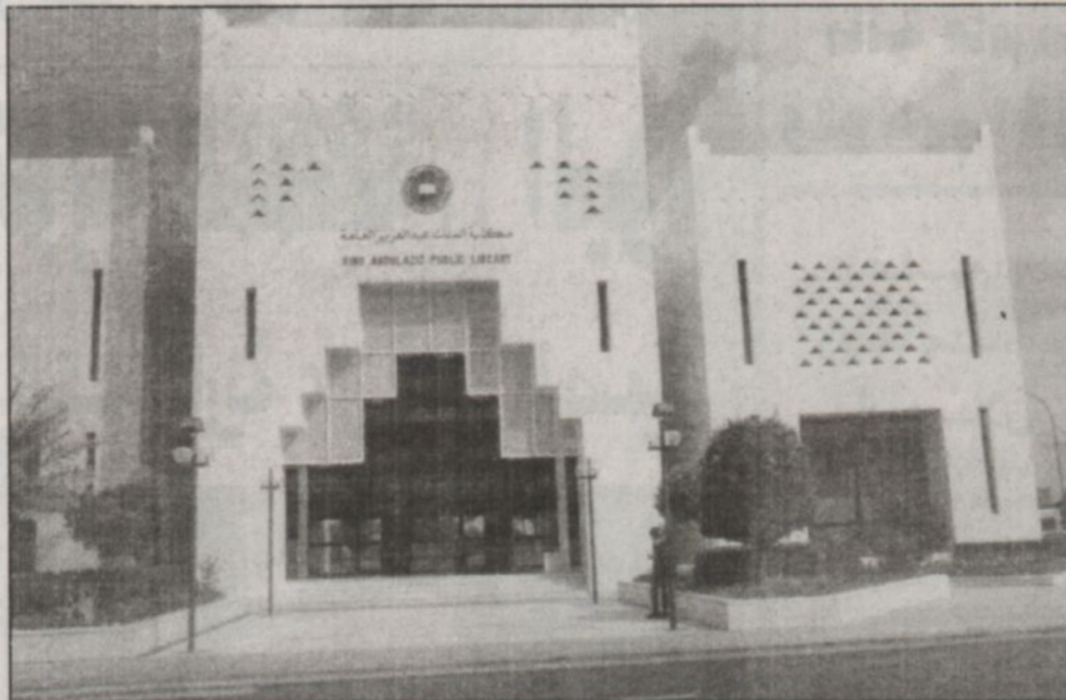
مكتبة الملك عبدالعزيز العامة بالرياض

في العالم وبما يخدم تاريخ الملك المؤسس - رحمه الله - وتاريخ المملكة العربية السعودية والتراث العربي والإسلامي وقد تم تجهيز موقع المكتبة وسوف تبدأ الخدمة قريباً مع بدء تقديم خدمة الانترنت في المملكة.