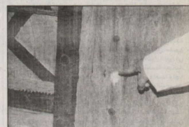
بقايا الحربة التي انكسرت