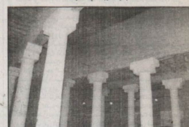
جانب من أعمال الترميم داخل القصر