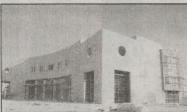
المبنى جاهز لافتتاح مع المناسبة المئوية ويلاحظ روعة التصميم

وأضاف المعمر قائلاً: ان مكتبة الملك عبدالعزيز العامة قامت في بادئة غير مسبوقه بإنتاج برنامج حاسوبي يحكي بالصوت والصورة حياة وكفاح الملك المؤسس عبدالعزيز بن عبدالرحمن آل سعود - طيب الله ثراه - وسيرته الذاتية وسوف تصدر النسخة الثانية من البرنامج (باللغتين العربية والانجليزية) خلال شهر شوال القادم متضمنة الكثير من الإضافات العلمية والتقنية واللغوية بما يتوافق مع مناسبة الاحتفال. وقال ابن معمر انه بدأ تجهيز موقع مكتبة الملك عبدالعزيز العامة في شبكة المعلومات العالمية (انترنت) وهي خطوة من شأنها عرض جميع ما تحتويه من فهارس وقواعد معلومات لجميع المستفيدين