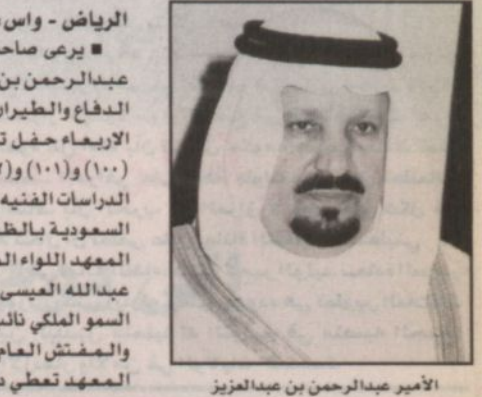
الأمير عبدالرحمن بن عبدالعزيز

الرياض - واس، يري صاحب السمو الملكي الأمير عبدالعزيز بن عبدالعزيز نائب وزير الدفاع والطيران والمفتش العام اليوم الأريضاء حفل تخريج الدورات (٩٩) و (١٠٠) و (١٠١) و (١٠٢) من طلبة معهد الدراسات الفنية للقوات الجوية الملكية السعودية بالظهران. أوضح ذلك قائد المعهد اللواء المهندس الركن علي بن عبدالله العيسى مبيثاً ان رعاية صاحب السمو الملكي نائب وزير الدفاع والطيران والمفتش العام لحفل تخريج دورات المعهد تعطي دفعة قوية للخريجين