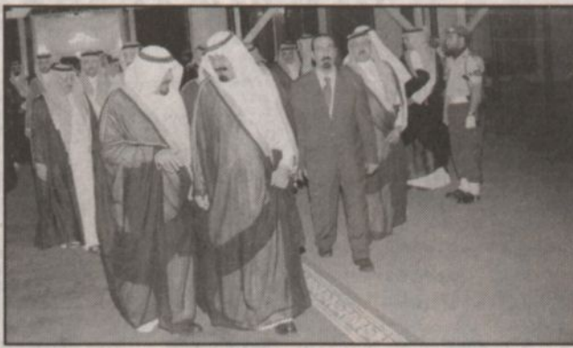
الأمير عبدالله وحديث مع الأمير سلطان لدى مغادرته الرياض

وعالي وزير العدل الدكتور عبدالله بن محمد بن إبراهيم آل الشيخ وعالي وزير الشؤون الإسلامية والأوقاف والدعوة والإرشاد الشيخ صالح بن عبدالعزيز بن محمد آل الشيخ وعالي وزير المياه والكهرباء الدكتور غازي بن عبدالرحمن القصيبي وعالي وزير المالية الدكتور إبراهيم بن عبدالعزيز الصافي وعالي رئيس ديوان سمو ولي العهد الأستاذ ناصر بن حمد الراجحي وعالي المستشار بديوان سمو ولي العهد الأستاذ عبدالحسن بن عبدالعزيز التويجري وعالي رئيس الشؤون الخاصة بديوان سمو ولي العهد الأستاذ إبراهيم بن عبد الرحمن الطاسان وعالي نائب رئيس ديوان سمو ولي العهد والسكرتير الخاص الأستاذ خالد بن عبدالعزيز التويجري وعالي المستشار بديوان سمو ولي العهد ومدرب مروض على الشؤون الصحية بالحرس الوطني الدكتور فهد بن عبدالله العبدالجبار وعالي وكيل المراسم الملكية الأستاذ محمد بن عبدالرحمن الطيبي وسفير خادم الحرمين الشريفين لدى كوالالمبور السفير حامد يحيى.