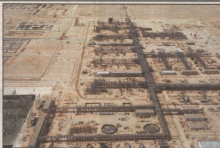
أحد معالم فرز الغاز

مكانة المملكة كمورد للطاقة يمكن للعالم ويكفل ثلثه أن يعتمد عليه وتعزير عائدات المملكة من استثمار ثرواته البترولية.