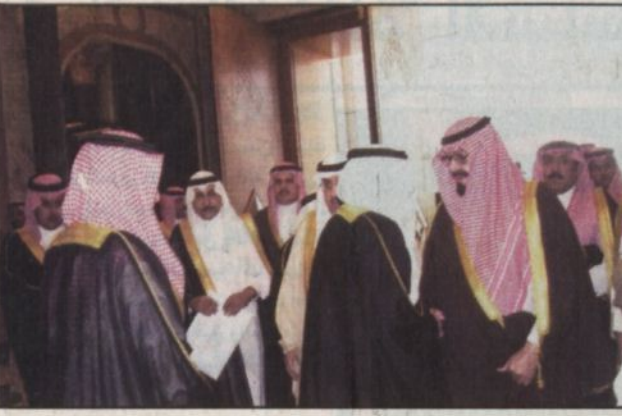
الرياض - واس، استقبل صاحب السمو الملكي الأمير عبد الله بن عبد العزيز ولي العهد ونائب رئيس مجلس الوزراء ورئيس الحرس الوطني في الديوان الملكي بقصر اليمامة امس أصحاب السمو الملكي الأمراء وسماحة مفتي عام المملكة الشيخ عبدالعزيز بن عبدالله آل الشيخ وفصلية رئيس مجلس القضاء الأعلى الشيخ صالح بن محمد اللحيدان وأصحاب الفضيلة العلماء والمشايخ الذين قدموا للسلام على سموه.

حضر الاستقبال صاحب السمو الأمير محمد بن عبد الله بن جلوي وصاحب السمو الملكي الأمير فهد بن محمد بن عبد العزيز وصاحب السمو الملكي الأمير نهار بن سعود بن عبد العزيز وصاحب السمو الأمير الدكتور بندر بن سلمان بن محمد آل سعود المستشار في ديوان سمو ولي العهد ومعالى المستشار في ديوان سمو ولي العهد الأستاذ عبد المحسن بن عبد العزيز التويجري ومعالى المستشار في ديوان سمو ولي العهد المشدوب المفوض على الشؤون الصحية بالحرس الوطني الدكتور فهد العبدالجبار.