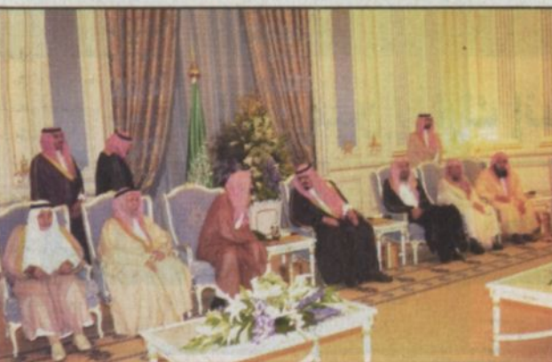
سمو ولي العهد يستقبل الأمراء والمشايخ والعلماء