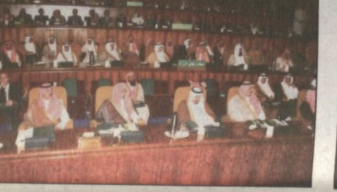
أصحاب السمو الأمراء والمعالي الوزراء خلال حفل الافتتاح