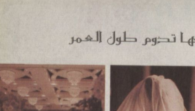
أصحاب السمو الأمراء والمعالي الوزراء خلال حفل الافتتاح

جاء من الخالق سبحانه وتعالى مما جعله نظاماً صالحاً ومتناسقاً لا يعرف الاضطراب والتناقض، لأنه يعتمد على الوحي الإلهي. ثانياً، ثبات الأجر والثواب في قول الحكم والسعي إلى تنفيذ. ثالثاً، المساواة فالناس كلهم سواسية أمام الجهات القضائية، يعملون بالعدل دون النظر إلى الجاه أو المنصب أو اللون أو الدين أو الجنس. رابعاً، الشمول، فهو نظام شامل وكامل مما جعله قادراً على استيعاب كل القضايا المستجدة خامساً، الاستقلال وهو سمة مهمة من سمات أي نظام قضائي، ولهذا نصت الأنظمة القضائية بالمملكة العربية السعودية على هذا المبدأ حيث جاء في النظام الأساسي للحكم أنه لا سلطان على القضاء في فضائه لغير أحكام الشريعة الإسلامية. وأكد قائلاً ان مسيرة القضاء في المملكة العربية السعودية منذ عهد المؤسس الملك عبدالعزيز بن عبدالرحمن آل سعود رحمه الله إلى هذا العهد عهد خادم الحرمين الشريفين يحفظه الله تشهد نموًا متواصلًا وقد تجسد هذا النمو مؤخرًا بنقلة متميزة تمثلت باكتمال عقد منظومة الأنظمة القضائية حيث صدر نظام المرافعات الشرعية، ونظام المحاماة، ونظام الإجراءات الجزائية. واكتمال هذه المنظومة وتناغم صدور النواحي التنفيذية لهذه الأنظمة استطاع القول وبشدة إن إجراءات التقاضي في المملكة قد وصلت إلى مرحلة تبعت على الاطلاق وأنا شخصياً راض عما حققه معرفتي ومعاشيتي للجهود التي بذلت في اعداد هذه الأنظمة وصياغة نصوصها، اجدي اليوم - وفي هذه المناسبة - بحاجة إلى تأكيد أهمية التعريف بها وتأميل نصوصها وتعميق مضامينها، وما هذه الندوة الا جزء من الجهود التي يبذلها الوزارة في هذا الاتجاه.