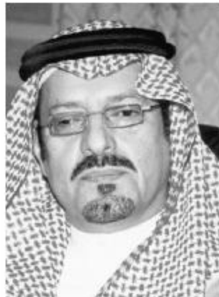
الأمير سعود بن عبد المحسن

الجزيرة: إن كل المؤشرات تدل على الاهتمام بالقطاعات التعليمية والصحية واهتمامها بالمشاريع التي لها مساس براحة المواطن سواء البلدية منها والاجتماعية أو الطرق وبعض مشروعات البنية الأساسية. وتنهت للقيادة الحكيمة، مؤكداً أن سير يخطى تطويرية حديثة بفضل من الله ثم حسن قيادة حكومة مولاي خادم الحرمين الشريفين وسمو سدي ولي العهد الأمين وسمو النائب الثاني ونتيجة لاهتمامهم بتعاليم الشريعة الإسلامية وخدمتها لبيوت الله وخدمة الإسلام والسلمين.