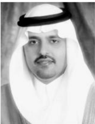
الأمير عبدالعزيز بن سعود وعلى تحقيق معدلات تنموية أعلى تصب في مصلحة المواطن وتسهم

في رفايته بإذن الله. وأشاد سموه باهتمام الدولة - رعاهما الله - بالقطاع التعليمي ودعم صناديق الأراض وقال سموه إن هذا توجه رائد يؤكد اهتمام حكومة خادم الحرمين الشريفين وسمو ولي عهده الأمين بالمواطن في مجال تعليم وصحته وإيجاد الفروض الميسرة لبناء المسكن وتوفير وسائل الراحة وسد احتياجاته وأمر سموه من تهنئة لخدمات الحرمين الشريفين وسمو ولي عهده الأمين وسمو النائب الثاني مؤكداً أن المستقبل في ظل القيادة الكريمة يجعل معه الكثير من الخيرات لهذه البلاد الطاهرة ولشعبها الوفي.