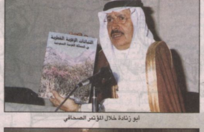
أبو زنادة خلال المؤتمر الصحفي

تغطية - فهد الزومان وجه نائب خاد الحرمين الشريفين صاحب السمو الملكي الأمير عبدالله بن عبدالعزيز - يحفظه الله - بتعريب الإصدار الأول للمرجع النباتي «النباتات الفطرية الزهرية في المملكة» الذي أهدى لسموه. صرح بذلك الدكتور عبدالعزيز بن خالد أبو زنادة الأمين العام للهيئة الوطنية لحماية الحياة الفطرية وإنمائها خلال المؤتمر الصحفي الذي عقد بمقر الهيئة للتعريف بالكتاب. وقال الدكتور أبو زنادة إن نائب خاد الحرمين الشريفين - يحفظه الله - قد وجه بتعريب الإصدار ليستفيد منه أكبر عدد من الباحثين في المملكة والدول العربية. كما أن صاحب السمو الملكي الأمير سلطان بن عبدالعزيز النائب الثاني لرئيس مجلس الوزراء وزير الدفاع والطيران والمفتش العام قد وافق على أن تتعاون الهيئة الوطنية لحماية الحياة الفطرية وإنمائها مع وزارة الزراعة والمياه والمدن العسكرية بالملكة لإقامة مسيجات للحفاظ على النباتات وبنوك البذور في المملكة والتي موافقة سموه لدعم المحافظة على النبات في المملكة. وقد تبرع المؤلف والنشرون ببيع الكتاب لصالح صندوق دعم الحياة الفطرية. وقال الدكتور عبدالعزيز أبو زنادة إن إصدار هذا الكتاب يأتي بالتزامن مع احتفالاتنا بمرور مائة عام على تأسيس المملكة العربية السعودية وقد قامت الباحثة البريطانية شيلا كولونين وبالتعاون مع الهيئة بإصدار هذا الكتاب وبدعم من عدة كبير من رجال الأعمال والشركات والمؤسسات داخل المملكة. وهذا الكتاب القيم الذي يقع في ٨٠٠ صفحة من القطع الكبير، هو مرجع شامل مصور، ذو إخراج فخيم وغلاب قوي التي يوضح الزهور البرية للسلطة العربية السعودية في بيئاتها الطبيعية، مع وصف مختصر لكل منها، وملحوظات حول موقعها.