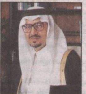
الأمير خالد الفيصل

المكي الأمير خالد الفيصل بن عبدالعزيز أمير منطقة عسير رئيس مجلس إدارة مصلحة المياه والصرف الصحي بالمنطقة أمس المشاركين في الاجتماع التنسيقي الرابع لقطاعات خدمات المياه بالملكة لدراسة مواجهة مشكلة الحاسب الآلي عمام ٢٠٠٠م وتأثيراتها على قطاعات المياه وذلك بمصالة الأمير خالد الفيصل