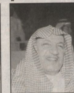
الشيخ دخيل الله بن فتن