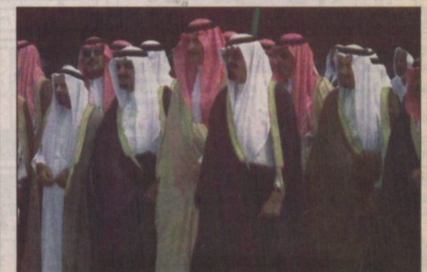
الأمير عبدالله يشرف حفل أهالي القطيف