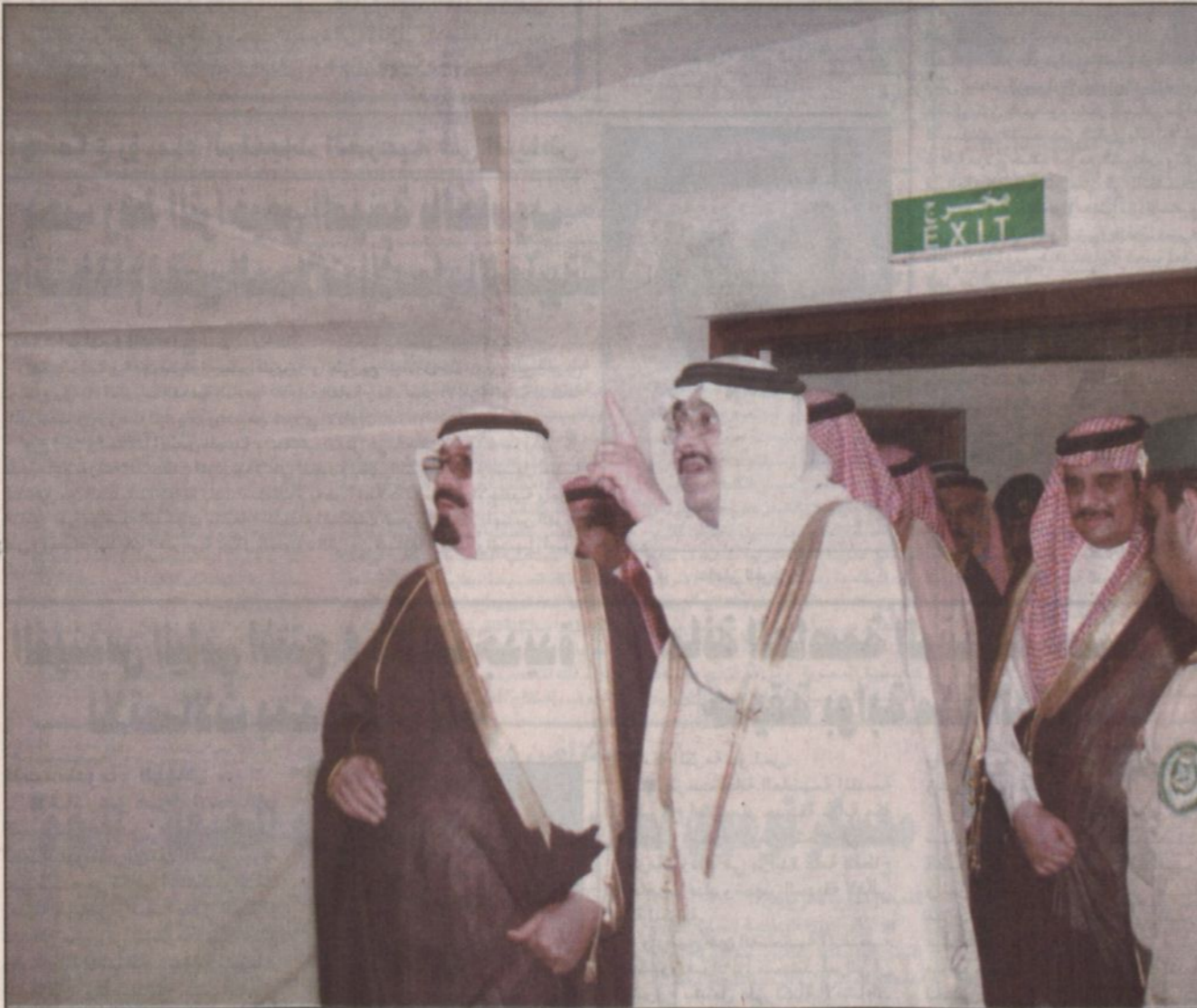
ويستمع إلى شرح من الأمير فيصل بن فهد