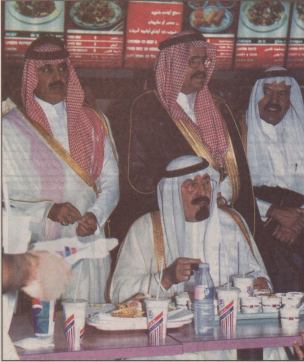
زيارة الأمير عبدالله لمجمع الراشد.. المفاجأة الجميلة..