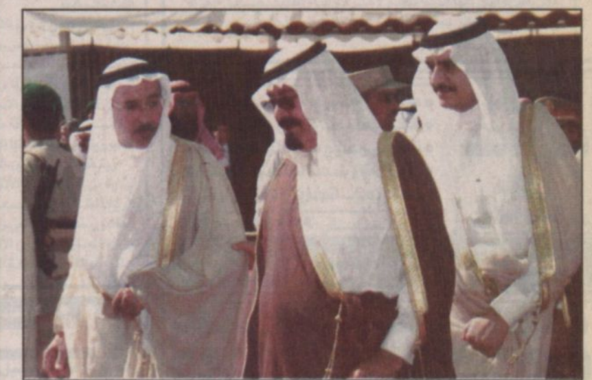
سموه الكريم لدى رعايته مشروع مصنع النسيج