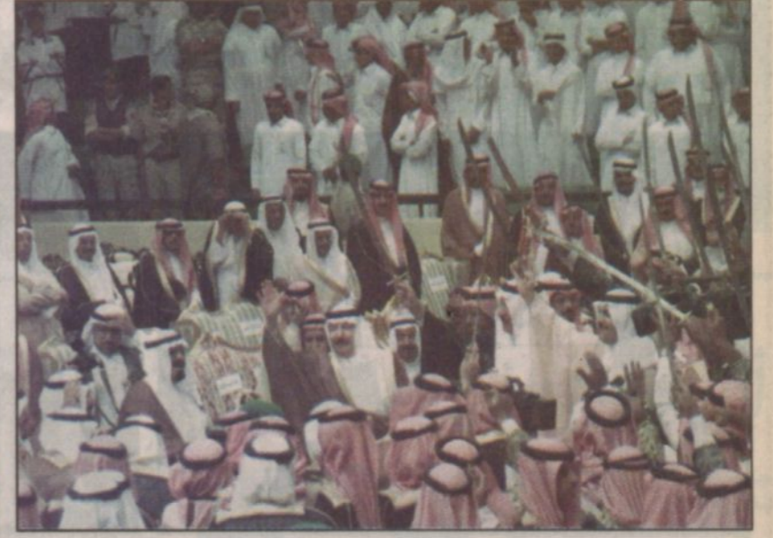
سمو ولي العهد يشارك في العرضة السعودية خلال زيارته الكريمة للمنطقة الشرقية

الله وسمو ولي العهد وسمو النائب الثاني لأبناء القوات المسلحة ومن بينها الحرس الوطني. جاءت زيارته الكريمة لمجمع الراشد في الخبر لتشير إلى ما يوليه سموه الكريم من اهتمام لأدق التفاصيل الاقتصادية.. ويكفي ما شوهد من فرحة غامرة عمت المجمع التجاري الذي ربما لم يكن يتوقع أي من العاملين فيه أن يحظى بشرف زيارة ثاني رجل في الدولة يهيمه أن تكون الملكة بحجم موقعها ريادة شاملة تغطي بمناخها الاقتصادي الرحب كل المشروعات والمنشآت الاقتصادية على اختلافها. إن نظرة واحدة إلى الوجهة الفرحة واحتفالات الأهالي بسمو ولي العهد تعكس بصورة ضافية صافية محبة عميقة.. ولاء لا ينضب معينه لحكومة رشيدة يقودها خادم الحرمين الشريفين وسمو ولي العهد وسمو النائب الثاني حفظهم الله.