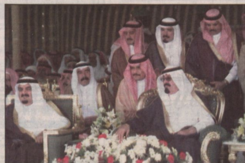
سموه الكريم في منصة الحفل خلال رعايته لأحد المشروعات بالمنطقة