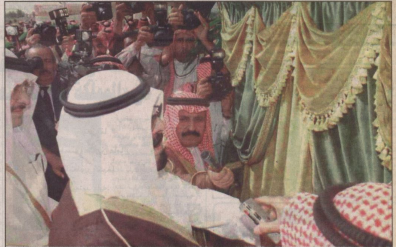
سمو ولي العهد يفتتح مدينة القطيف الرياضية حيث النشء يأخذ حيزاً كبيراً من اهتمام الدولة