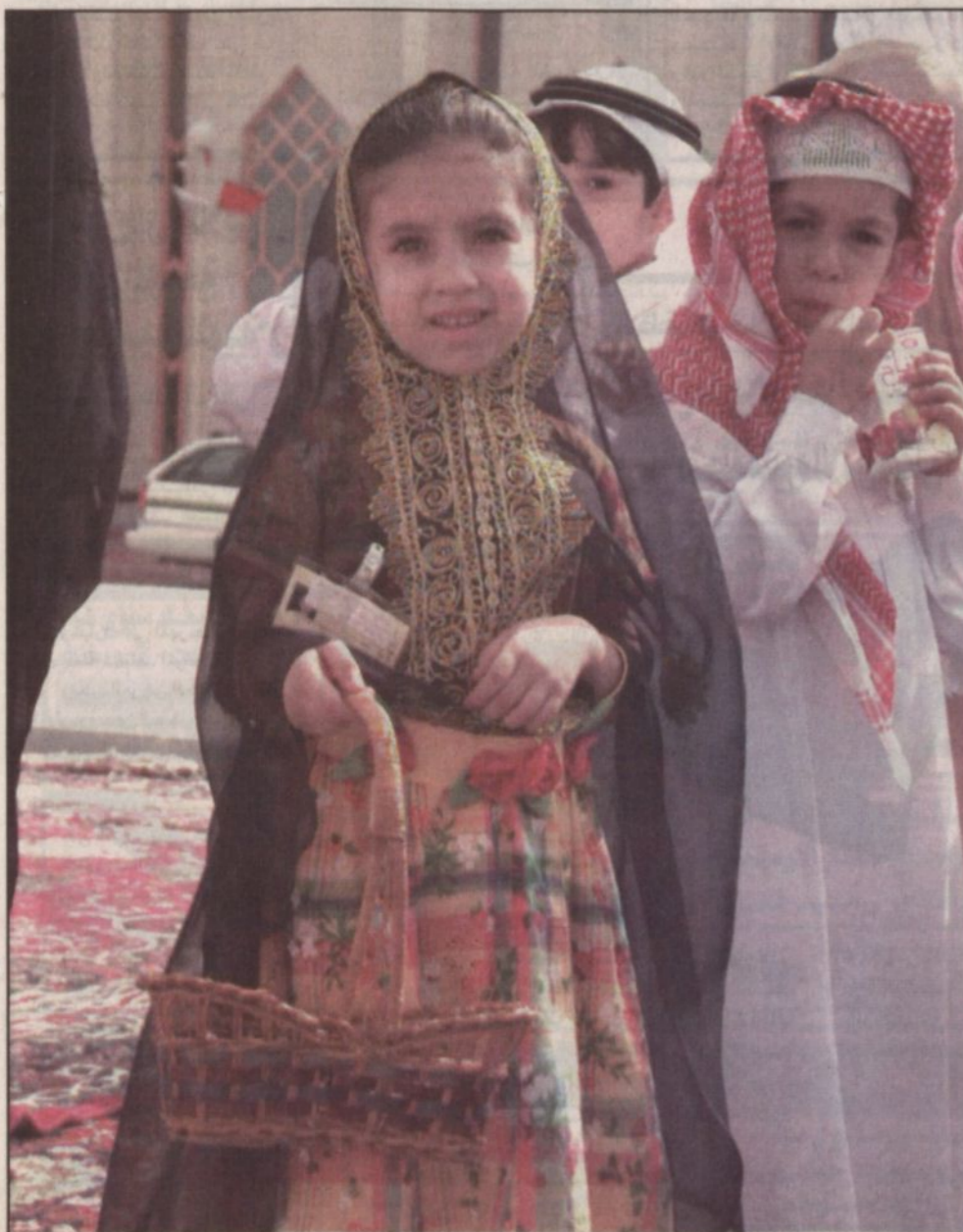
الطفولة كان لها دورها في التعبير عن مشاعر الفرحة الغامرة بزيارة سمو ولي العهد