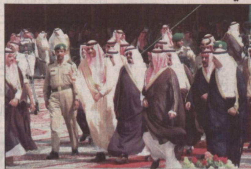
فعاليات زيارة الأمير عبدالله للمنطقة شملت قطاعات تنموية مختلفة