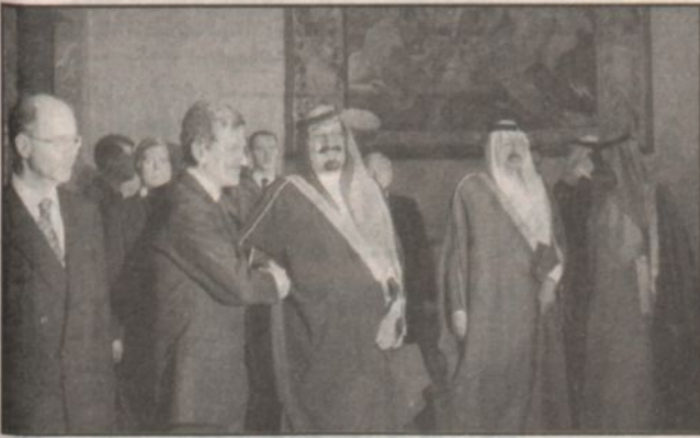
جانب من لقاء الأمير عبد الله مع رئيس الوزراء الإيطالي