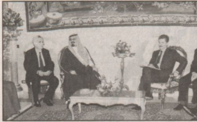
زيارة سمو الأمير عبد الله لرئيس الوزراء الإيطالي