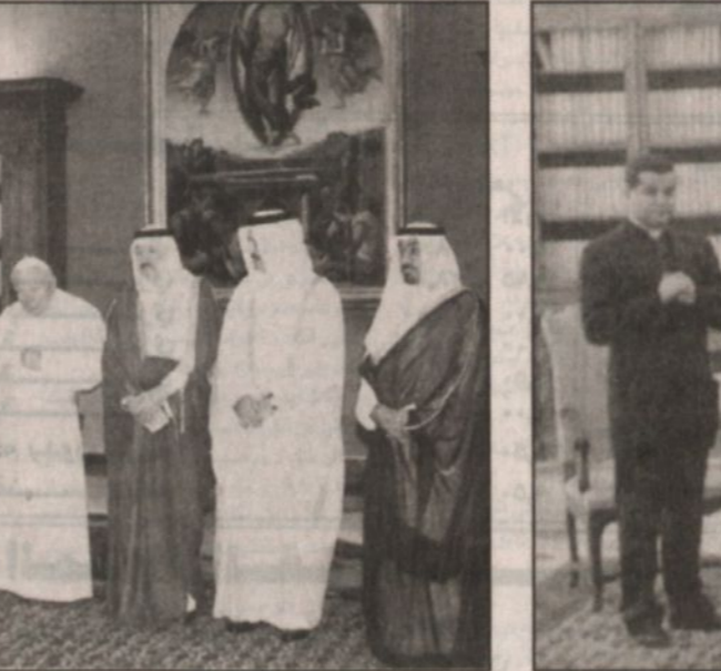
زيارة سمو ولي العهد للفاتيكان ولقاءه بابابا