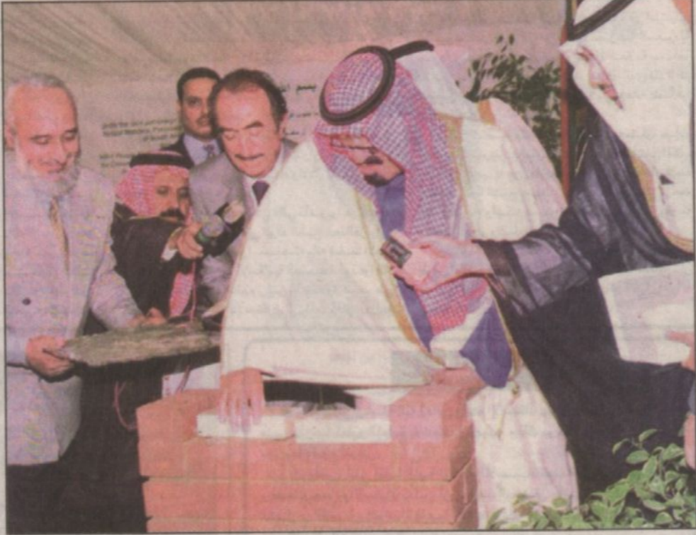
الأمير عبدالله يضع الحجر الأساس لجامع خادم الحرمين في جوهانسبرج جوهانسبرج، بريتوريا - و.ا.س.: ■ وضع صاحب السمو الملكي الأمير عبدالله بن عبدالعزيز ولي العهد ونائب رئيس مجلس الوزراء ورئيس الحرس الوطني أسس الحجر الأساس لجامع خادم الحرمين الشريفين الملك فهد بن عبدالعزيز في مدينة جوهانسبرج بجمهورية جنوب أفريقيا.