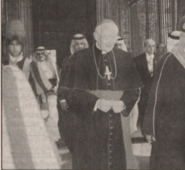
جانب من لقاء سمو الأمير عبد الله مع رئيس الوزراء الإيطالي

كما أن زيارة إيطاليا تؤكد بعداً جديداً في السياسة الخارجية للمملكة تقوم على أساس «الانفتاح التام» على التجارب والتوجهات للدول والمسؤولين فيها، حيث إن رئيس وزراء إيطاليا