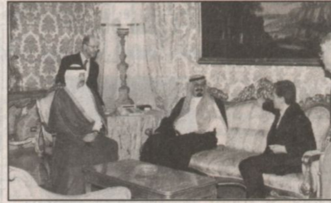
جانب من اجتماع سمو الأمير عبد الله مع رئيس الوزراء الإيطالي