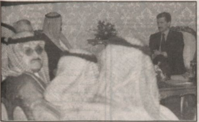
جانب من اجتماع سمو الأمير عبد الله مع رئيس الوزراء الإيطالي