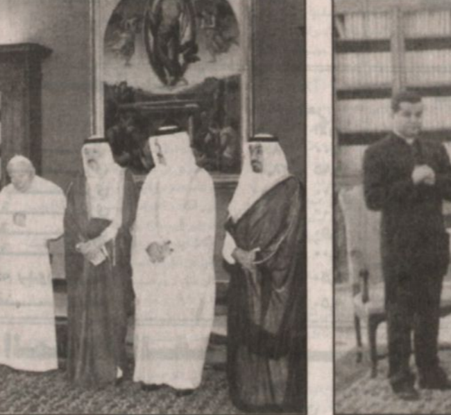
جانب من لقاء سمو الأمير عبد الله مع رئيس الوزراء الإيطالي