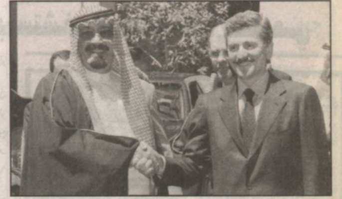
سمو الأمير عبد الله ورئيس الوزراء الإيطالي