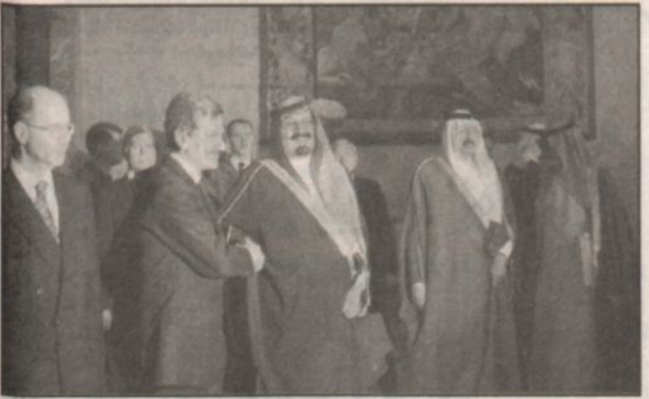
جانب من لقاء الأمير عبد الله مع رئيس الوزراء الإيطالي