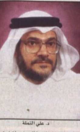
د. علي النملة

بدر - منصور رحيمي، أكد الدكتور علي بن إبراهيم النملة وزير الشؤون الاجتماعية ان الوزارة رفعت الى الجهات المعنية لائحة جديدة للضمان الاجتماعي تشمل عدداً من البنود من بينها امكانية رفع الاعانة التي تصرف لمستحقي الضمان الاجتماعي بالإضافة إلى الكثير من الحالات من بينها الزامل والمطلقات وسرف الاعانة بشكل شهري لهن وذلك ضمن بنود اللائحة الجديدة التي ستعالج مثل هذه الحالات. وأوضح النملة ان الوزارة تدرس ادراج المواطنين من السعوديين واصحاب الرواتب المتدنية التي تقل عن ١٥٠٠ ريال شهرياً في قائمة المستفيدين من اعانة الضمان الاجتماعي مشيراً إلى ان التفاصيل ستوضح في حالة اللائحة من قبل الجهات المعنية قريباً وان الوزارة بصدد تحويل مكاتب