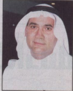
محمد عبداللطيف جميل

وأضاف سموه قائلاً: إن هذه المبادرة تستحق الشكر وأريحية ليست منكم بمستغربة جديدة بالثناء وأتمنى أن يكون هذا مثالا يحذو حذوه أخواني رجال الأعمال الآخرون تجاه دينهم وبلادهم وهو أمر غير مستغرب منهم بإذن الله قال الله تعالى: ﴿لمثل هذا فليعمل العاملون﴾ وأنتم ولا شك تعلمون أن تنمية بلادنا الغالية والمحافظة على مكتسبات التنمية هدف مشترك لكل ورجل الأعمال المخلص هو ذلكم الذي يقدم اسهامات يعود خيرها للجميع ورأس المال الخير هو ذلك الذي يلمس نفعه الناس في شتى المجالات فالله عزوجل يقول: ﴿فأما الزيد فليذهب جفاء وأما ما ينفع الناس فيمكث في الأرض﴾. واذ نتمن لكم هذا العمل الخير ونقدر لكم هذا الاسهام المتميز لئسأل الله عزوجل أن يتقبل منا ومنكم صالح الاعمال وأن يجعل أعمالنا جميعاً خالصة لوجهه الكريم وأن يوفق الجميع لعمل الخير والدلالة عليه.