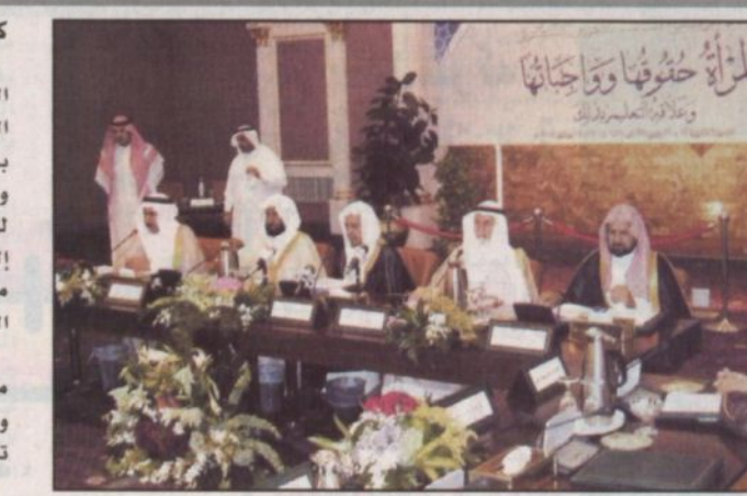
الحوار الوطني الثالث - المرأة حقوقها وواجباتها

كتب - يحيى زليع: دعا معالي الشيخ صالح عبدالرحمن الحصين رئيس اللقاء الوطني الثالث للحوار الفكري ووسائل الإعلام إلى المساهمة في تحقيق اهداف اللقاء الوطنية.. والاخذ بمبادئه السامية التي يسعى الجميع لترسيخها كمنهج وطني شامل مؤكداً معاليه ان التغطية الاعلامية الصحفية للمهام التي يقوم بها المركز لا تحتمل الاثارة التي لا تستند إلى الحقيقة، لأن عملاً كهذا لن يسهم في خدمة المتلقي من جهة ويسبب لجهود المشاركين او العاملين في أي من المجالات التي يتناولها المركز. وحد معاليه الاعلاميين على اخذ المعلومات من مصادرها الدقيقة حتى تكون الصورة في النهاية واضحة ومعبرة بصدق عن جهود المركز وأهدافه التي يسعى إلى تحقيقها. وشدد الشيخ صالح الحصين على اهمية رسالة وسائل الاعلام فيما يتعلق بأعمال مركز الملك عبدالعزيز للحوار