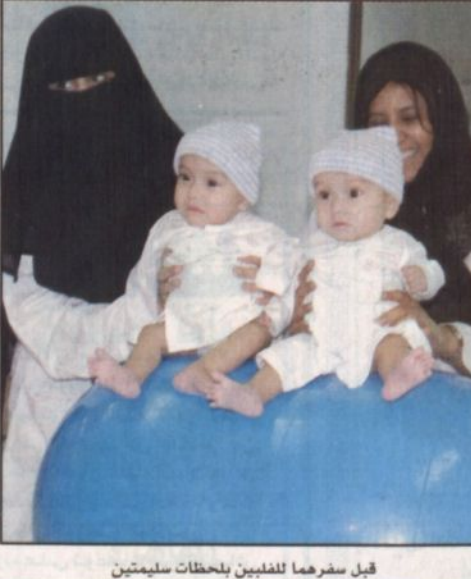
قبل سفرهما للفلبين بلحظات سليمتين

تواجدهما لمدة ستة أشهر في المملكة العربية السعودية. وابدت فخامتها شكرها وتقديرها للفرق الطبية السعودي الذي أجرى العملية برئاسة الدكتور عبدالله الربيعية وقد ذكرت فخامتها بأن هذه العملية لها تين الطفلتين ستترك اثرا ايجابيا سواء للشعب الفلبيني او للعالمية الفلبينية الموجودة في المملكة التي تقدر بحوالي مليون فلبيني. وكانت سفارة خادم الحرمين الشريفين لدى جمهورية الفلبين قد قامت بإجراء استقبال حافل في المطار حيث تم نقل وقائع الاستقبال مباشرة على الهواء في إحدى القنوات الفضائية الفلبينية وكذلك المؤتمر الصحفي الذي عقد في مطار اكينو الدولي فور وصول الطيارة المقلية للطفلتين.. وقد شارك في الاستقبال رسمية وخاصة بالإضافة إلى عدد من الصحفيين لمختلف الصحف. وكان التوأم قد غادر المملكة يوم أمس الأول الثلاثاء بعد نجاح العملية الجراحية التي تمت فضلها بمدينة الملك عبدالعزيز الطبية للحرس الوطني بالرياض في ٢٩ محرم لعام ١٤٢٥هـ الموافق ٢٠ مارس ٢٠٠٤ متجهتين إلى مطار مانيلا بالفلبين. وكان التوأم السيامي الفلبيني قد وصل إلى مدينة الملك عبدالعزيز الطبية بالرياض يوم الخميس ١١/٣٠/١٤٢٤هـ الموافق ٢٢/١/٢٠٠٤ وذلك بتوجيهات من صاحب السمو