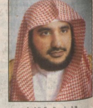
الشيخ صالح آل الشيخ

رئيس قسم الفلك بمدينة الملك عبدالعزيز: القمر أكثر لمعاناً وأكبر حجماً هذه الأيام