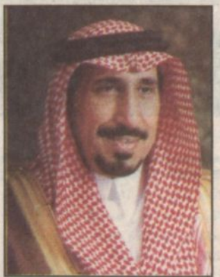
الأمير مشعل بن سعود