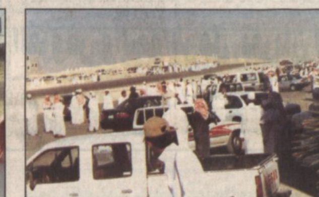
كثافة جماهيرية لمشاهدة التفحيط

متابعة - عبدالله الرزين: يشهد حي الصحافة بين وقت وآخر ظاهرة (تفحيط) بزلات خلال هذه الأيام خاصة بعد أداء الطلاب لاختباراتهم وبالتحديد بعد ظهر يوم أمس الأربعاء في الشوارع المقابِل للدفاع المدني من جهة الشرق فقد كان الجميع من هؤلاء التفحيط ومشاهدته على موكب مع عدد من المراهقين الذين استغلوا السيارات الفارهة التي اشتريتهم لهم من نوبم في عملية التفحيط ففي ظل غياب الرقيب الأمني الذي لم يكن له أي تواجد خلال الأيام الماضية وقد حضر يوم أمس متأخراً وفي لحظات قليلة جدا اختفى المحطون والمشاهدون في منظر مخيف جدا